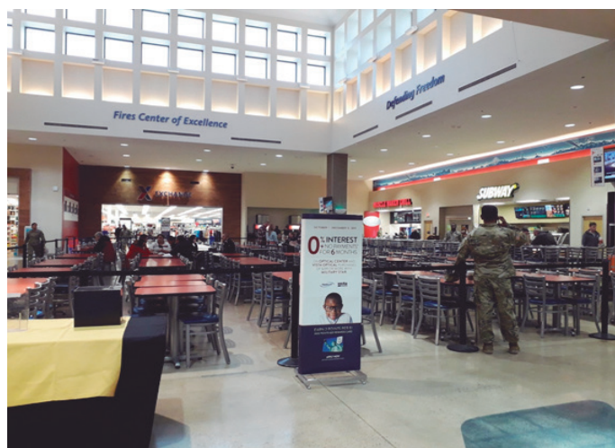
Figura 3 – Shopping com praça de alimentação localizado dentro do Fort Sill para atender a família militar com isenção de impostos

Existem três programas principais voltados para o apoio à família dos militares norte-americanos no interior das bases militares. O Programa de Manutenção da Missão desenvolve atividades que permitem o bem-estar físico e mental das famílias. Consiste na oferta gratuita de academias de ginástica, esportes aquáticos, bibliotecas, parques com áreas para piquenique e competições desportivas diversas. O Programa de Apoio Comunitário oferece serviços como desenvolvimento infantil, recreação ao ar livre, desenvolvimento de habilidades de artes e ofícios, desenvolvimento de habilidades automotivas, dentre outras. O Programa Moral, Bem-Estar e Recreação ( Morale, Welfare and Recreation – MWR , na sigla em inglês) destina-se a oferecer uma série de atividades para a família com preços reduzidos. Estão incluídos campos de golfe, alojamentos recreativos, pista de boliche, clubes, atividades náuticas e outros. Há ainda outras ações, como prevenção ao suicídio, abuso de substâncias lícitas, educação preventiva contra o uso de substâncias ilícitas etc.