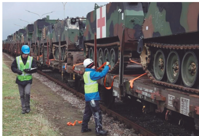
Figura 2 – Veículos blindados de estoque pré-posicionado na base do US Army na Alemanha sendo transportados para emprego no Exercício Defender 2020

A capacidade de projetar forças expedicionárias é de fundamental importância. As tropas precisam ser dispostas no local e no momento apropriados, garantindo uma vantagem estratégica. Para isso, o US Army trabalha para manter estoques pré-posicionados de armas e suprimentos de tamanho adequado para atender as necessidades iniciais do combate. É um trabalho que, ao ser concluído, pretende permitir alta velocidade no desdobramento de tropas em qualquer lugar, com o material e o armamento mais apropriado para a área de atuação. Para facilitar o acionamento, estão sendo montados kits de acordo com o ambiente operacional. Os kits possuem material de comunicações, sistemas modernos de armas, sistemas de detecção de explosivos e o Sistema de Proteção Ativa (APS) 2 .