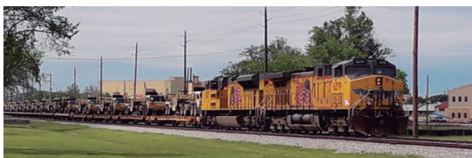
Figura 1 – Ferrovia e trem do US Army no interior do Fort Sill

As residências e facilidades militares também estão recebendo uma atenção especial. O US Army reconhece que o militar precisa saber que a família está sendo bem assistida em suas necessidades para que esteja mais focado, tornando-se mais resiliente. Nesse sentido, as residências estão recebendo melhorias, assim como as facilidades existentes dentro das bases militares que atendem as famílias.