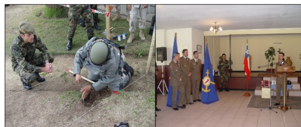
Figura 5: Instructores do Exército de Terra da Espanha no CEDDEX (Chile)

La asesoría y capacitación internacional se reflejó en el envío por parte del Centro Internacional de Desminado (CID), de la Academia de Ingenieros del Ejército de Tierra de España, en los años 2004, 2006, 2007 y 2008, de instructores para desarrollar en el CEDDEX cursos EOD 11 Nivel 2 Instructor de Desminado.