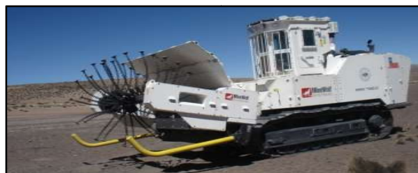
Figura 3: Bosena 5 Plus y Minewolf MW 370