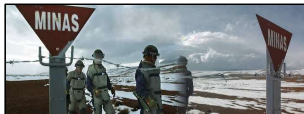
Figura 4: Sección de Desminado en acción en las Áreas minadas sector Tambo Quemado, altiplano chileno, comuna de Putre.

Dado el origen y la naturaleza de los campos minados emplazados a lo largo del territorio nacional, la mayor parte de las actividades del desminado humanitario para enfrentar el compromiso adquirido por el Estado Chileno fue ejecutada por la fuerza terrestre del Ejército. La capacitación y entrenamiento de más de 1.000 efectivos, hombres y mujeres así lo refleja.