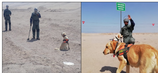
Figura 7: Aseguramiento de calidad con técnica de Desminado Canino en Quebrada Escritos, Arica.

Los perros son entrenados para detectar partículas de olor de sustancias explosivas y otras partes del cuerpo de la mina y/o UXO. A diferencia de los detectores de metales, herramientas comúnmente utilizadas en el desminado, un perro puede localizar minas terrestres ya sean de metal o plástico.