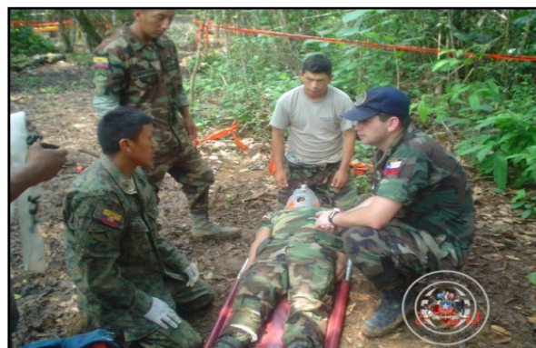
Figura 6: Oficiales chilenos Monitores OEA-JID en la frontera Ecuador - Perú