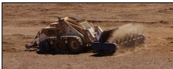
Figura 2: Bosena 5 Plus y Minewolf MW 370

En cuanto a la conformación de las unidades, estas normalmente se componen de 2 (dos) secciones de desminado manual y 1 (una) sección mecanizada, entre estas últimas destacan las unidades de desminado Bozena 5 Plus , Minewolf MW 370 y Demining Loader .