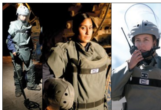
Figura 8: Personal femenino de la Unidad de Desminado “Arica”

Volviendo al tema desminado, es el Ejército quien tiene la responsabilidad de desarrollar las operaciones y en tal sentido, el enfoque de género de la institución se alinea con la política nacional y ministerial, al incorporar en forma muy efectiva, la participación de mujeres en el desminado humanitario.