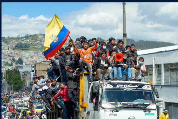
Manifestantes em caravana para a capital, Quito.