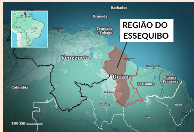
Mapa da região do Essequibo