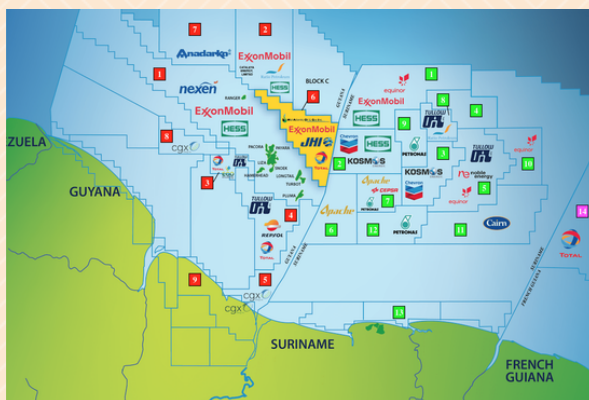
Blocos de exploração de petróleo no mar territorial guianense