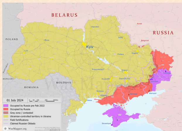
Território ucraniano hoje controlado pela Rússia