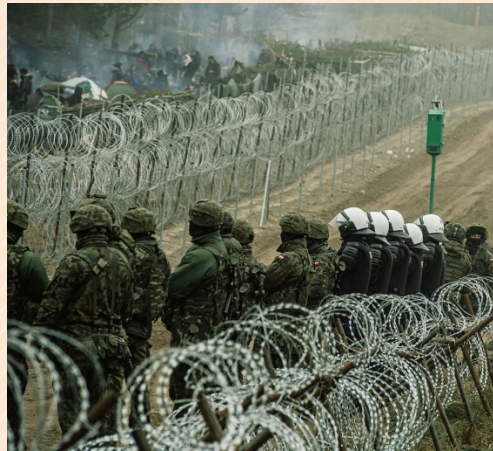
Fronteira Polônia / Belarus

O Informativo Estratégico é editado pelo Centro de Estudos Estratégicos do Exército/3ª Subchefia do Estado-Maior do Exército.