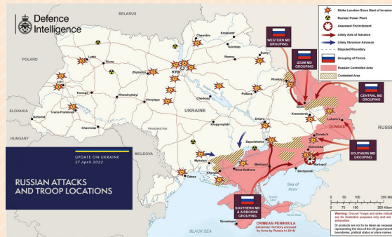
Situação da guerra na Ucrânia em 27 Abr 2022.