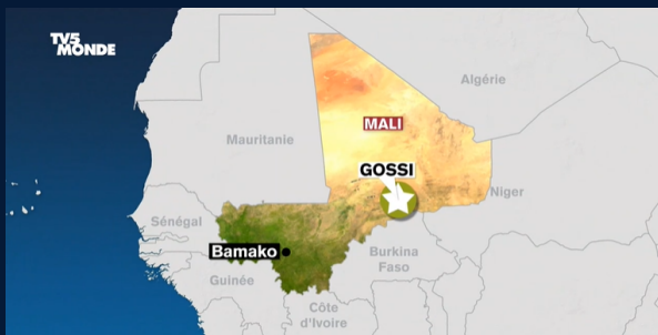
Mali / Fonte TV5 Monde

https://information.tv5monde.com/afrique/le-mali-accuse-l-armee-francaise-d-espionnage-et-lance-une-enquete-apres-la-decouverte-d-un