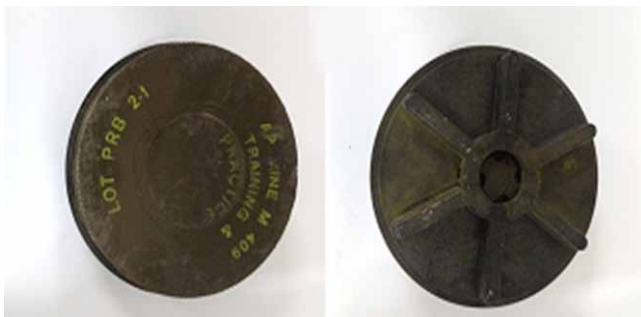
Fig. 1 - Exemplos de mina antipessoal das forças armadas brasileiras.

A mina terrestre é um artefato explosivo com o objetivo de criar um obstáculo, dificultando a passagem de indivíduos ou veículos em um determinado local. São enterradas e fabricadas normalmente com materiais duradouros como plástico, vidro ou metal. A forma mais comum de sua explosão é devido a pressão direta realizada sobre o local, embora também existam outras formas menos frequentes de ativação, tais como som, fios, vibrações e eletromagnetismo.