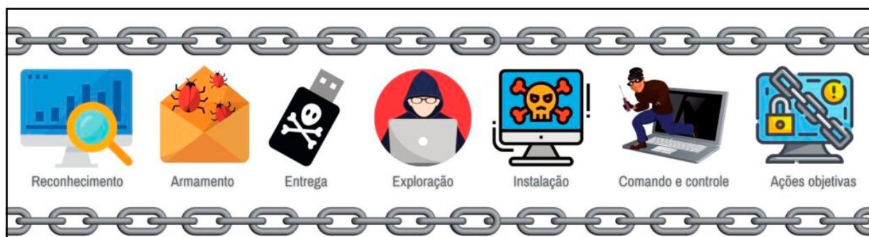
Fig 1 - Cyber Kill Chain® Lockheed Martin.

O modelo apresentado toma por base o conceito da cyber kill chain e foi elaborado pela empresa fabricante de produtos de defesa Lockheed Martin para identificar e prevenir a atividades cibernéticas intrusivas. Esse framework ilustra muito bem os passos que um atacante precisa executar até conseguir provocar um efeito sobre um alvo. O ataque é somente a ação final de “detonar uma bomba”, que foi customizada para penetrar nas defesas de um determinado alvo particular. A capacidade operativa de ataque cibernético só pode ser considerada factível por um