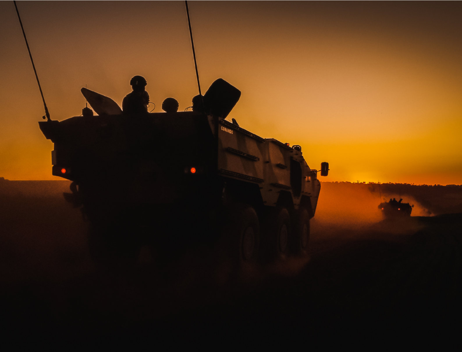
Fig 3 – VBTP-MSR GUARANI.

A experiência da brigada demonstra que a adaptação estratégica, o investimento em pessoal, o treinamento intensivo, a modernização de material, o apoio à educação e a infraestrutura adequada são elementos cruciais para o sucesso em