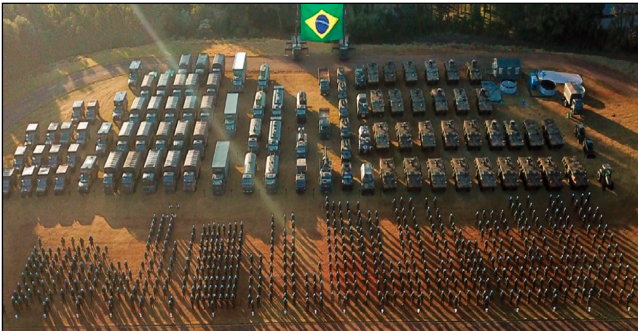
Fig 1 – Apronto operacional do batalhão mecanizado na UNPCRS.

Em resumo, a 15ª Brigada de Infantaria Mecanizada tem um rol de atribuições multifacetado. Sua missão abrange desde a defesa do território nacional até o apoio em situações de crise e missões de paz no exterior. A integração com outras agências, a coordenação eficaz e seu status como Força de Emprego Estratégico a tornam uma peça relevante na estratégia de defesa do Brasil e de sua inserção no cenário global.