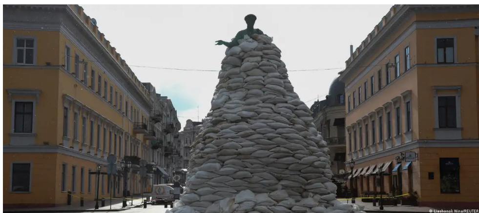
Fig 3 – Monumento no centro de Odessa

A organização não governamental de observação dos direitos humanos ( Human