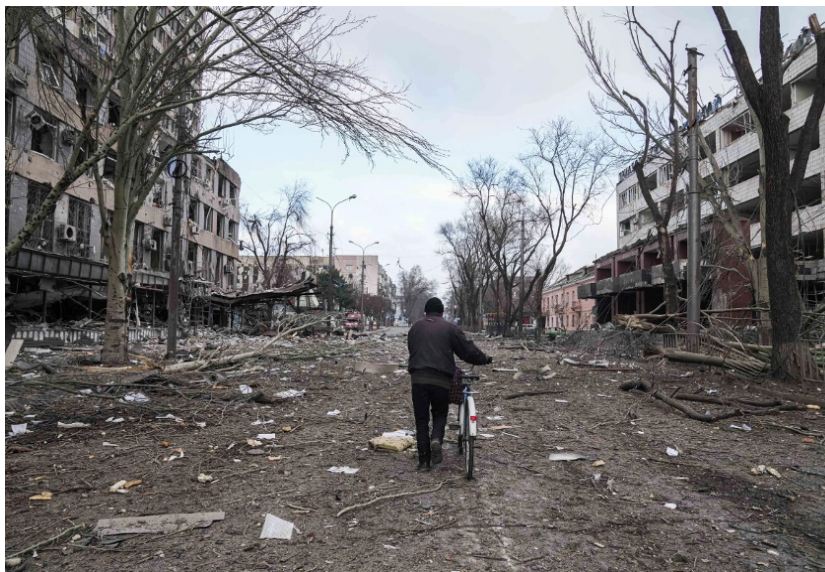
Fig 4 – Centro de Mariupol, Ucrânia, após ataque aéreo russo (Mar/22)