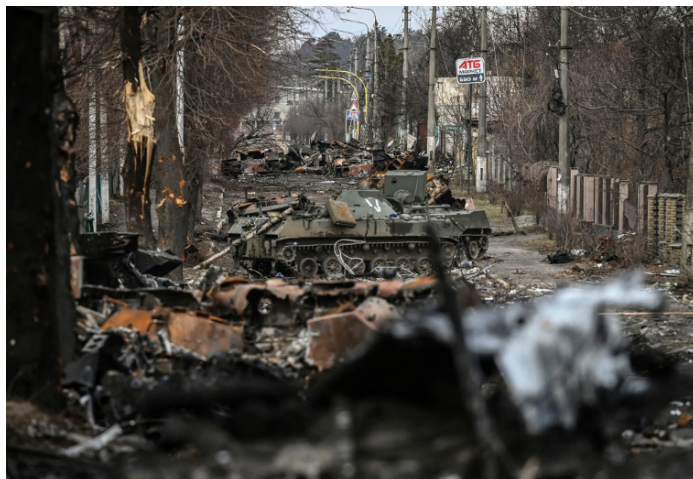
Fig 2 – Blindados russos destruídos na cidade de Bucha, Ucrânia (Mar/22)