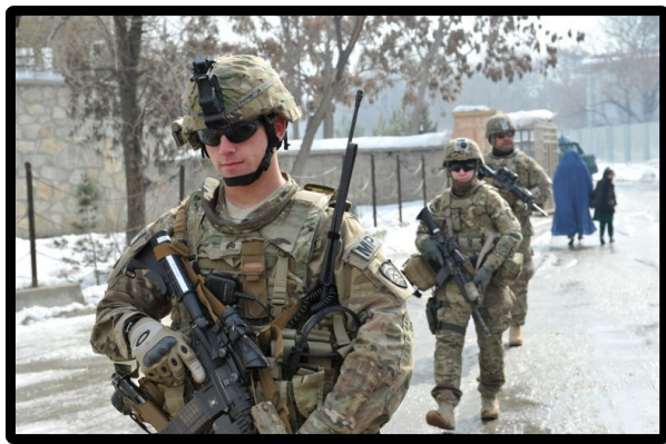
Patrulha de militares da Polícia do Exército, integrantes da 648ª MEB , em bairro de Kabul durante operação de estabilização, em 2012

Os conflitos eclodidos neste século têm apresentado desafios significativos às forças militares norte-americanas. A grande distância entre o território americano e as regiões onde a maioria de suas tropas atuaram nos últimos anos, somada à necessidade de um exército menor e mais versátil, tem influenciado sobremaneira a transformação doutrinária e estrutural do EEUA.