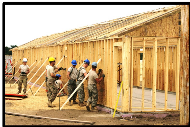
Integrantes da 157ª MEB constroem instalação no Fort McCoy Garrison, durante treinamento anual em 2016