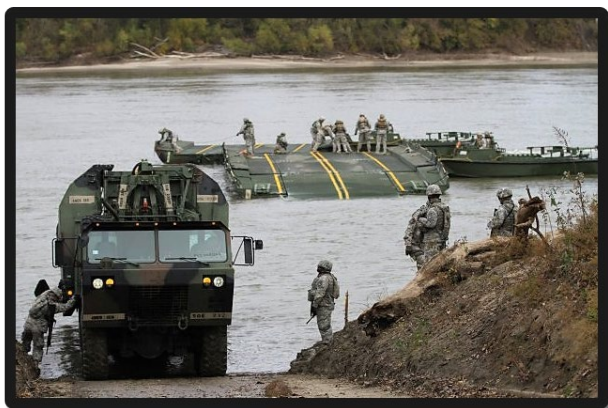
Subunidade de engenharia da 4ª MEB construindo portada Ribbon em Jefferson City , em 2014

A MEB conduz operações de apoio à manobra para aprimorar todas as tarefas de ações decisivas. Essas operações integram as capacidades complementares e de reforço que devem ser desenvolvidas dentro das funções de combate: movimento e manobra, proteção, e logística.