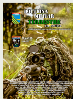
Foto de Capa: arquivo do CCOMSEX Descrição: caçador de operações especiais sendo utilizado como opção estratégica e alternativa tática. Autor: Sd Douglas