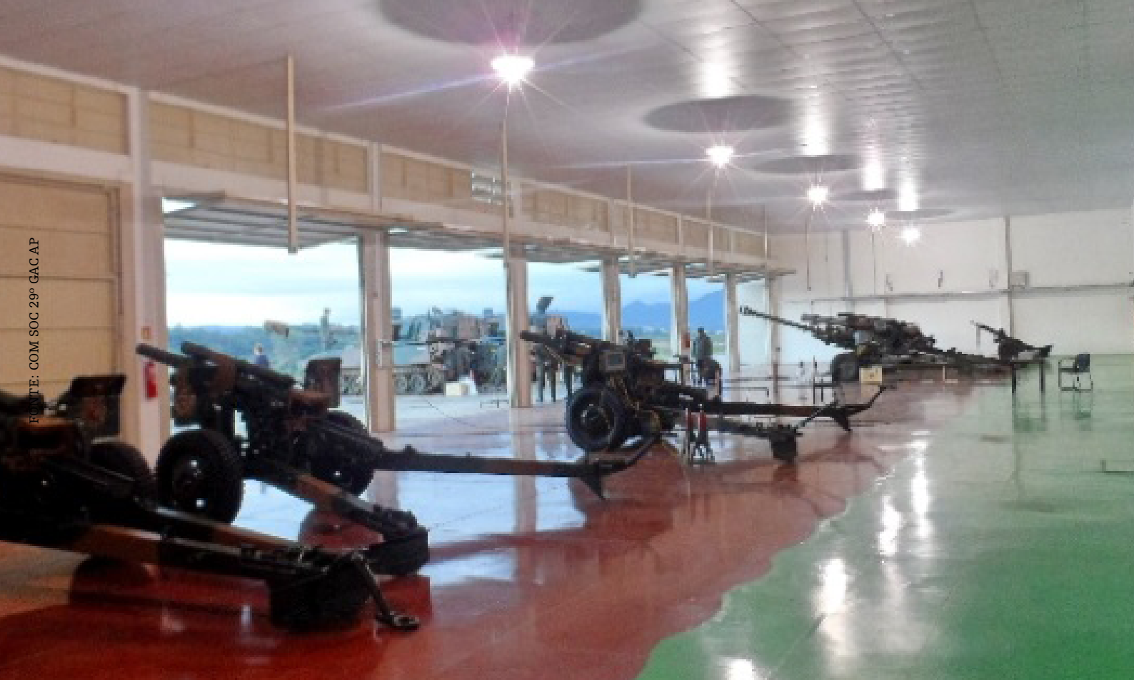
Posto da Linha de Fogo