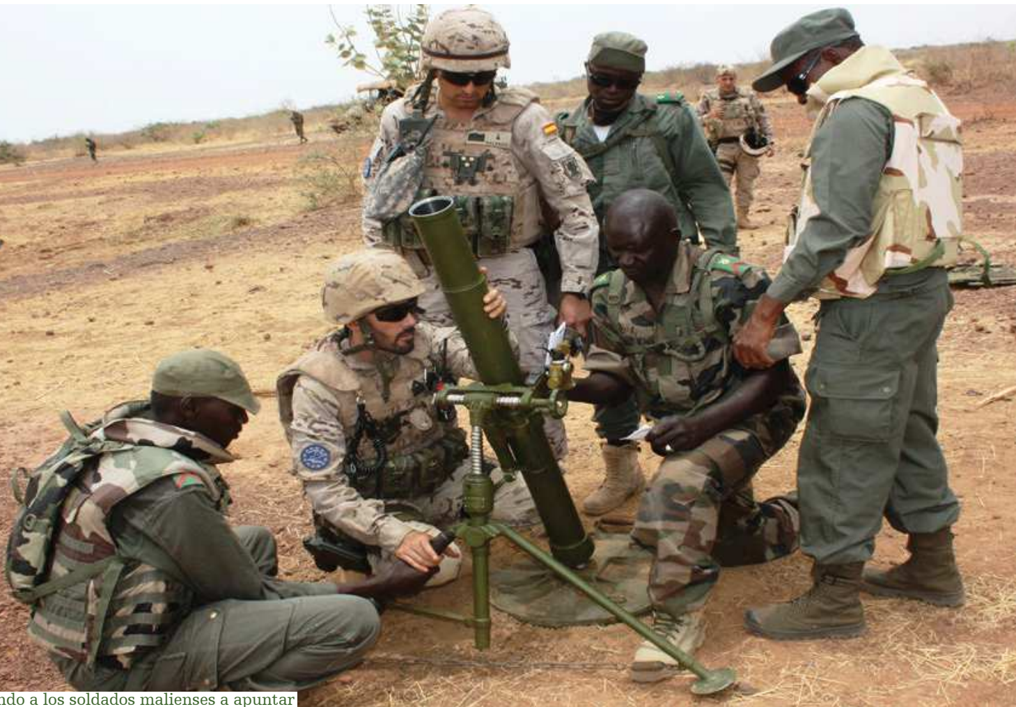
Enseñando a los soldados malienses a apuntar