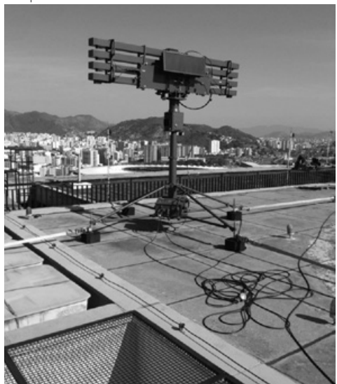
Figura 8: O Radar SABER M60 na defesa antiaérea das Olimpíadas Rio 2016

As Organizações Militares (OM) de Artilharia Antiaérea foram equipadas com o Radar SABER