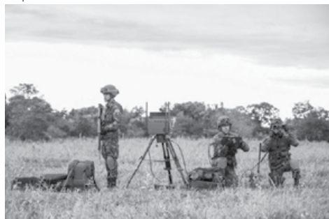
Figura 4: Militares do 9º B Com GE atuando em apoio às tropas do SISFRON

Alguns projetos abrangidos pelo Sistema já foram entregues. Como a etapa de testes está sendo realizada na região englobada pelo CMO, todas essas entregas, até agora, contemplam apenas essa região. Outros projetos estão sendo, aos poucos, finalizados. Como exemplos de ações já realizadas no SISFRON, podemos citar a criação do 9º Batalhão de Comunicações e Guerra Eletrônica, sediado em Campo Grande – MS; o destacamento de um Pelotão do 10º Regimento de Cavalaria Mecanizado para a cidade de Caracol – MS; a construção do centro de operações do CMO; a aquisição de optrônicos, rádios e meios de apoio aos atuadores; a aquisição de viaturas de comando e controle embarcadas em shelters; a implantação de centros de operações nas OM diretamente subordinadas à 4ª Brigada de Cavalaria Mecanizada; a aquisição de meios