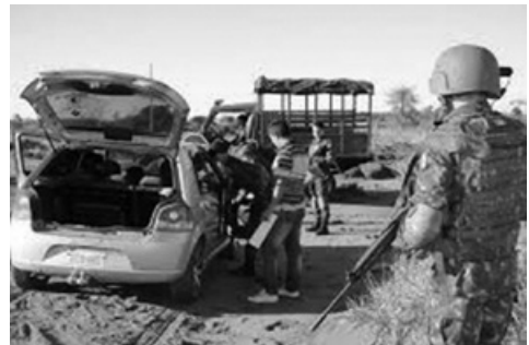
Figuras 2 e 3: Operação do SISFRON por militares da 4ª Brigada de Cavalaria Mecanizada

O SISFRON encontra-se, desde 2012, em fase de testes, desdobrado como um projeto piloto. Essa fase inicial está sendo desenvolvida no âmbito do Comando Militar do Oeste (CMO), que engloba os estados de Mato Grosso e Mato Grosso do Sul, estando a parte operacional desses testes a cargo da 4ª Brigada de Cavalaria Blindada, sediada em Dourados – MS. A parte técnica dos testes é gerenciada por diversas Organizações Militares