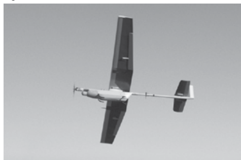
Figura 6: SARP HÓRUS FT100

a ser utilizado em operações no SISFRON. Nas operações na fronteira do Mato Grosso do Sul, já foi utilizado em operações conjuntas com órgãos de segurança pública para a identificação de pistas de pouso clandestinas. Assim como o radar SENTIR M20, possui emprego dual, podendo também ser utilizado para a busca de alvos no Teatro de Operações. Os primeiros militares a empregá-lo no SISFRON foram oriundos da Bateria de Busca de Alvos do 9º GAC.