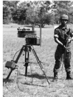
Figura 5: Radar SENTIR M20

Um dos materiais relevantes já entregues ao Exército em virtude do SISFRON é o radar de vigilância terrestre SENTIR M20. Trata-se de um radar portátil de curto alcance capaz de executar operações de vigilância, aquisição, classificação, localização, rastreamento e exibição gráfica automática de alvos em terra, tais como indivíduos em solo, tropas, blindados, caminhões, trens e helicópteros. Ele utiliza a tecnologia de abertura sintética, o que permite sua operação sob quaisquer condições meteorológicas, além de poder detectar uma pessoa a 10 km e veículos a 20km. Equipamento robusto e portátil, pode ser acondicionado em mochilas por 3 militares ou, até mesmo, ser adaptado para uma viatura. Sua operacionalização está sendo executada pelo CTEEx e pelo 9º Grupo de Artilharia de Campanha, sediado em Nioaque – MS, através de sua Bateria de Busca de Alvos. Cabe ressaltar que seu emprego é dual, podendo ser utilizado em operações de