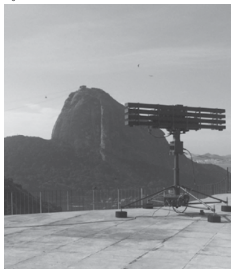
Figura 7: Radar SABER M60

de voo de determinadas aeronaves. No contexto do SISFRON, pode ser utilizado na repressão ao narcotráfico transfronteiriço, determinando a existência de aeródromos clandestinos. Pode-se inferir, pois, que os dois fatos conjunturais que impulsionaram este projeto foram o SISFRON e a necessidade de modernização da Artilharia Antiaérea brasileira face aos grandes eventos que o Brasil sediou recentemente (Jornada Mundial da Juventude, Copa do Mundo 2014 e Olimpíadas Rio 2016, por exemplo).