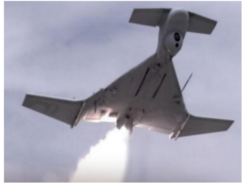
loitering munition HAROP

A seguir, serão apresentadas as características e a sequência das ações ocorridas durante o Conflito de Nagorno-Karabakh de setembro de 2020, com foco nas lições aprendidas para a Defesa Antiaérea da Força Terrestre neste início de século.