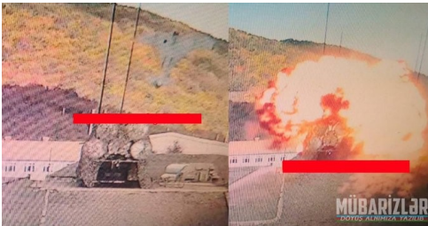
Figura 2 - HAROP azeri destruindo um S-300 PS armeno

foram destruídos por mísseis de precisão lançados pelo TB-2 ou pelo impacto direto em mergulho dos Harop em sua missão típica de supressão de defesa antiaérea inimiga (SEAD) (Figura 2).