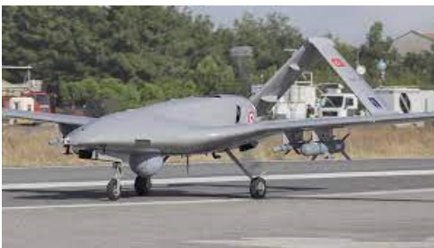
Figura 1 - SARP armado Bayraktar TB-2

O fato de o Azerbaijão ter vencido o conflito não consistiu em algo extraordinário, considerando a correlação de forças com a Armênia. O que se traduziu como inédito foi a peculiaridade da Segunda Guerra de Nagorno-Karabakh ter sido a primeira que foi praticamente decidida por plataformas remotamente pilotadas. O SARP armado de origem turca Bayraktar TB-2 e a munição de voo israelense Harop (Figura 1) dominaram o TO e possibilitaram ao Azerbaijão alcançar uma situação vantajosa que o conduziria à vitória (ANTAL, 2021).