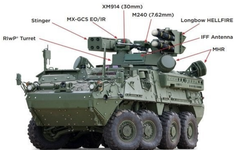
Figura 3 - Veículo blindado Stryker A1 IM-SHORAD