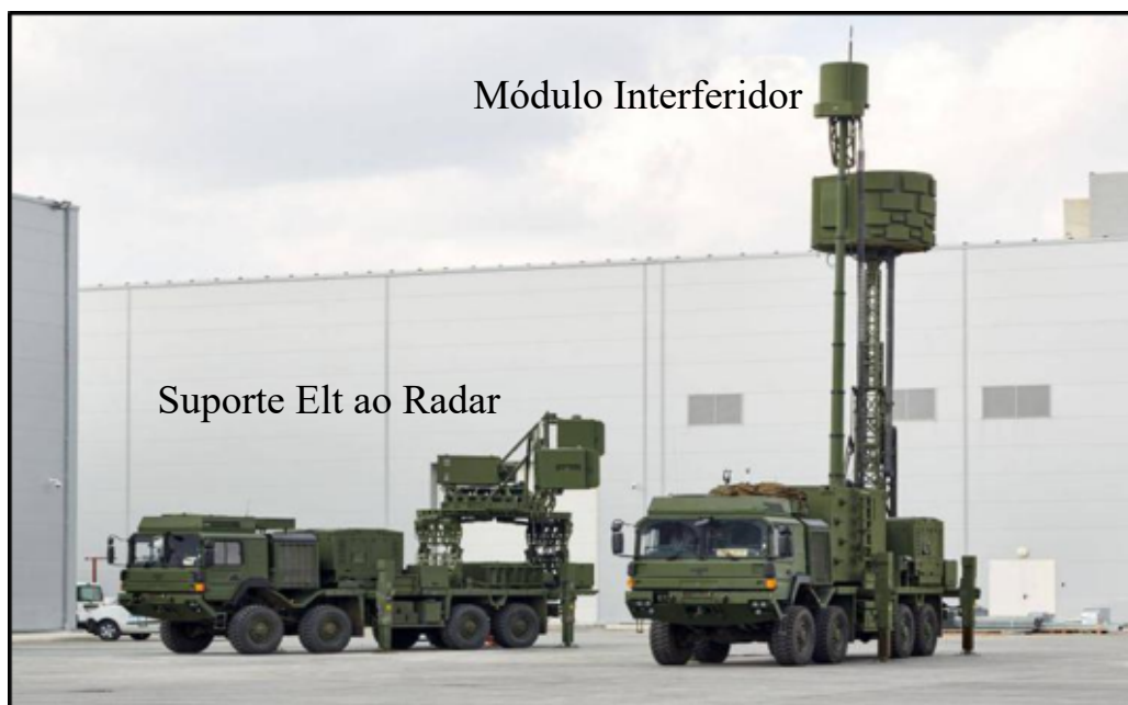
Figura 4 – Sistema de GE KORAL

contra os sistemas de DAAe armenos foi o emprego do sistema de GE de fabricação turca Koral (Figura 4), cuja função é bloquear radares e canais de comunicação sem fio. Cabe ressaltar que a Turquia havia se sobreposto às defesas antiaéreas sírias anteriormente através do desdobramento de um sistema Koral próximo à localidade de Idlib (RUBIN, 2020).