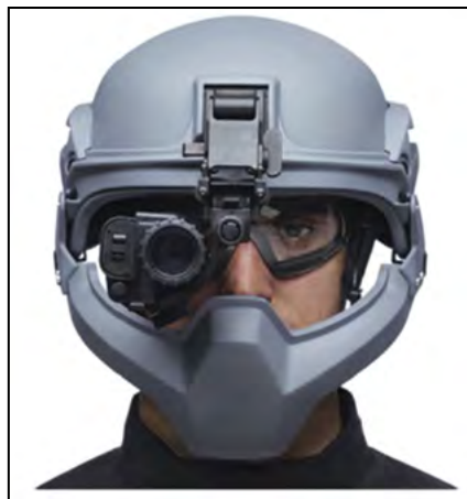
Figura 1 Protótipo britânico de capacete balístico com proteção mandibular adicional.

Breeze et al. (2011) chamam a atenção para o fato de que os atuais equipamentos de proteção individual não apresentam adequada cobertura das regiões facial e cervical. Dessa forma essas regiões estão mais suscetíveis a lesões no combate moderno.