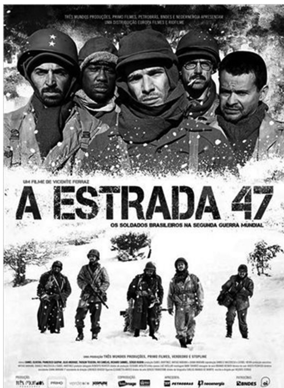
Figura 2 – Cartaz oficial do filme A Estrada 47 7

que muitas outras análises podem ser feitas sobre ambos os filmes, bem como que a presente análise pode ser aplicada aos outros longas-metragens de ficção sobre a Segunda Guerra Mundial que listamos anteriormente. Ocorre que entendemos como mais significativo para exemplificar o pensamento ilustrado nas páginas anteriores escolher estas duas obras e este caminho analítico.