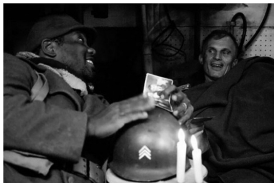
Figura 4 – Os combatentes brasileiro e alemão mostram as fotos de suas famílias no filme A Estrada 47 23

O fato de o filme contar apenas com uma cena de confronto também é marcante, pois traz a ideia de que o maior problema ali enfrentado é o da própria consciência, o constante medo da morte e a igualmente constante falta de razão do conflito que se presencia. Aliadas ao frio nunca antes experimentado por estes brasileiros, estas questões tornam-se mais perigosas e mortais do que o próprio conflito irracional.