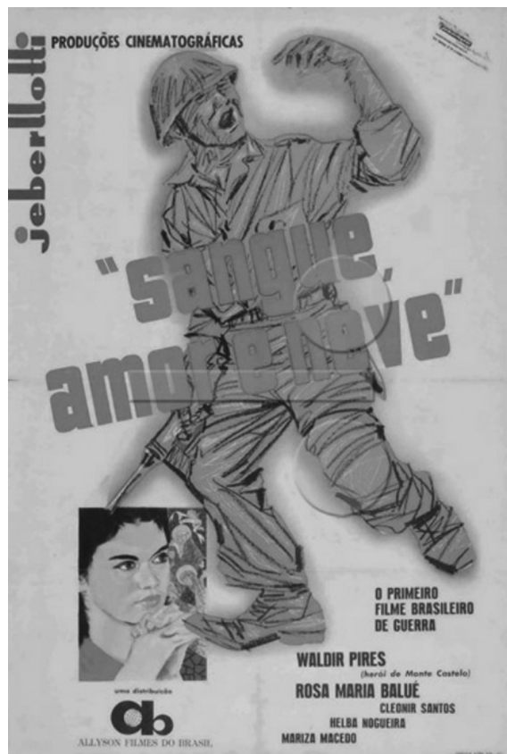
Figura 1 – Cartaz oficial do filme Sangue, amor e neve 6

Sangue, amor e neve , no contexto deste trabalho, foi classificado como um romance de guerra, subclassificado como mobilizador. A Estrada 47 , também no presente trabalho, foi classificado como um drama de guerra, subclassificado como pacifista. Cabe destacar