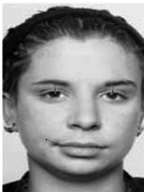
Figura 7 – Desprezo

N. da R. referente a todas as figuras desta página: as setas são uma adaptação de F.A.C.E. training system pelo autor. Fonte: EKMAN, 2007.