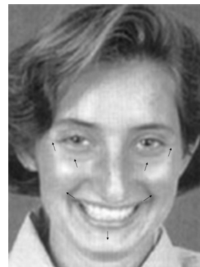
Figura 3 – Alegria