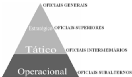
Figura 1 - Níveis operacional, tático e estratégico de uma Organização Militar

O militar que se encontra em função de comando, da mesma forma que um administrador, tem as funções de planejar, organizar, dirigir e controlar o processo de trabalho. O planejamento figura como a primeira função administrativa por ser aquela que serve de base para as demais funções. Dentro de uma Organização Militar, o planejamento pode ser exemplificado conforme demonstra a Figura 1.