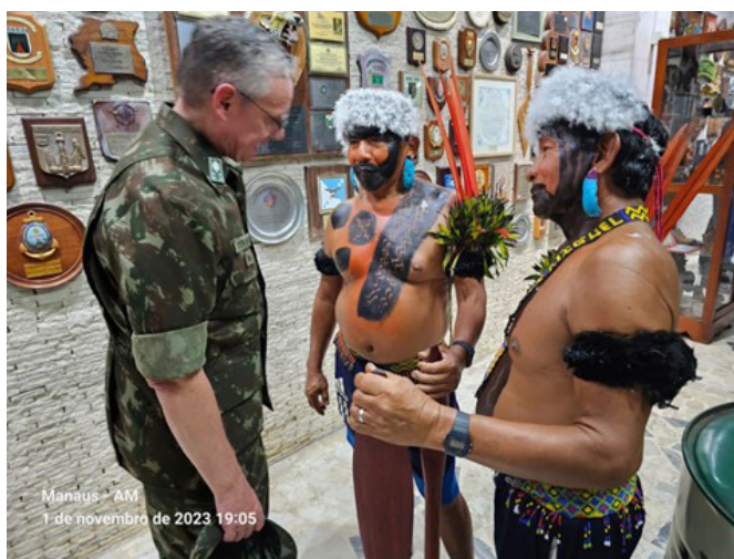
Figura 2 – Comandante do CMA – Gen Ex Costa Neves com lideranças Yanomami em evento de aniversário do CMA.

O objetivo deste texto foi apresentar um retrato dos efetivos indígenas incorporados às fileiras do CMA. Outros textos estão programados para aprofundarem na questão dos soldados indígenas com lentes diferentes. O objetivo é mostrar de forma abrangente o panorama da relação entre os soldados e os guerreiros