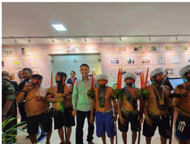
Figura 3 – Assessor Especial do CMA para assuntos indígenas e lideranças Yanomamis da região de Maturacá em evento aniversário do CMA