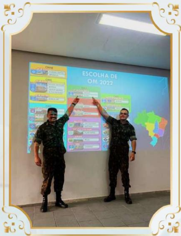
Congratamento após escolha de Organizações Militares.