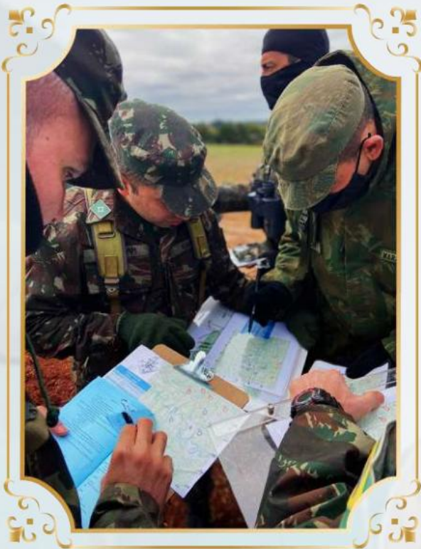
Exercício no Terreno – Santo Ângelo – Operações Ofensivas – Aproveitamento do Êxito e Junção.