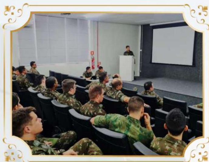
Seminário Doutrinário no Comando de Comunicações e Guerra Eletrônica do Exército – Brasília-DF.