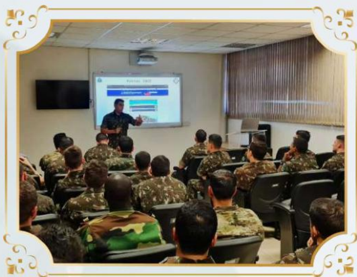
Visita de Atualização Técnica em Brasília-DF