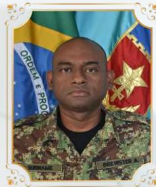
Cap BREWSTER (SURINAME)