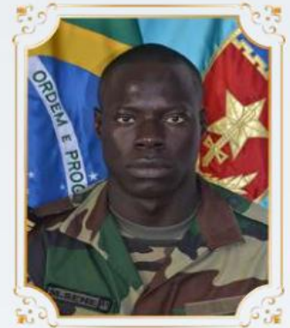
Cap SENE (SENEGAL)