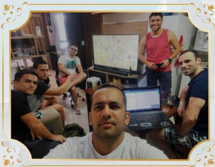
Preparação para as provas.