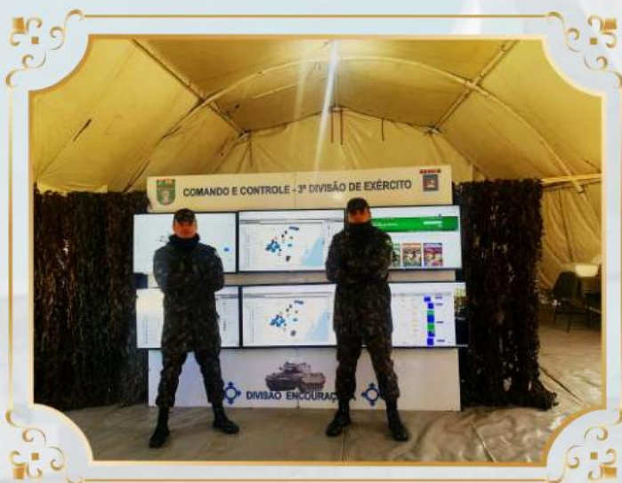
Visita às Instalações do 1º Batalhão de Comunicações.