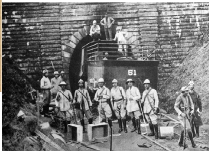
Figura 02: Soldados paulistas ocupando o túnel.

Uma vez estando sozinhos na luta, os paulistas foram obrigados a permanecer imobilizados no Vale do Paraíba, tendo como limites a Serra da Mantiqueira ao norte e a Serra do Mar a sul. Estabeleceram uma linha de resistência em local situado na divisa entre os estados de Minas Gerais e São Paulo. Mais precisamente, foi entre as cidades de Passa Quatro (MG) e Cruzeiro (SP) que as forças instalaram sua base de combate na antiga “estação túnel”