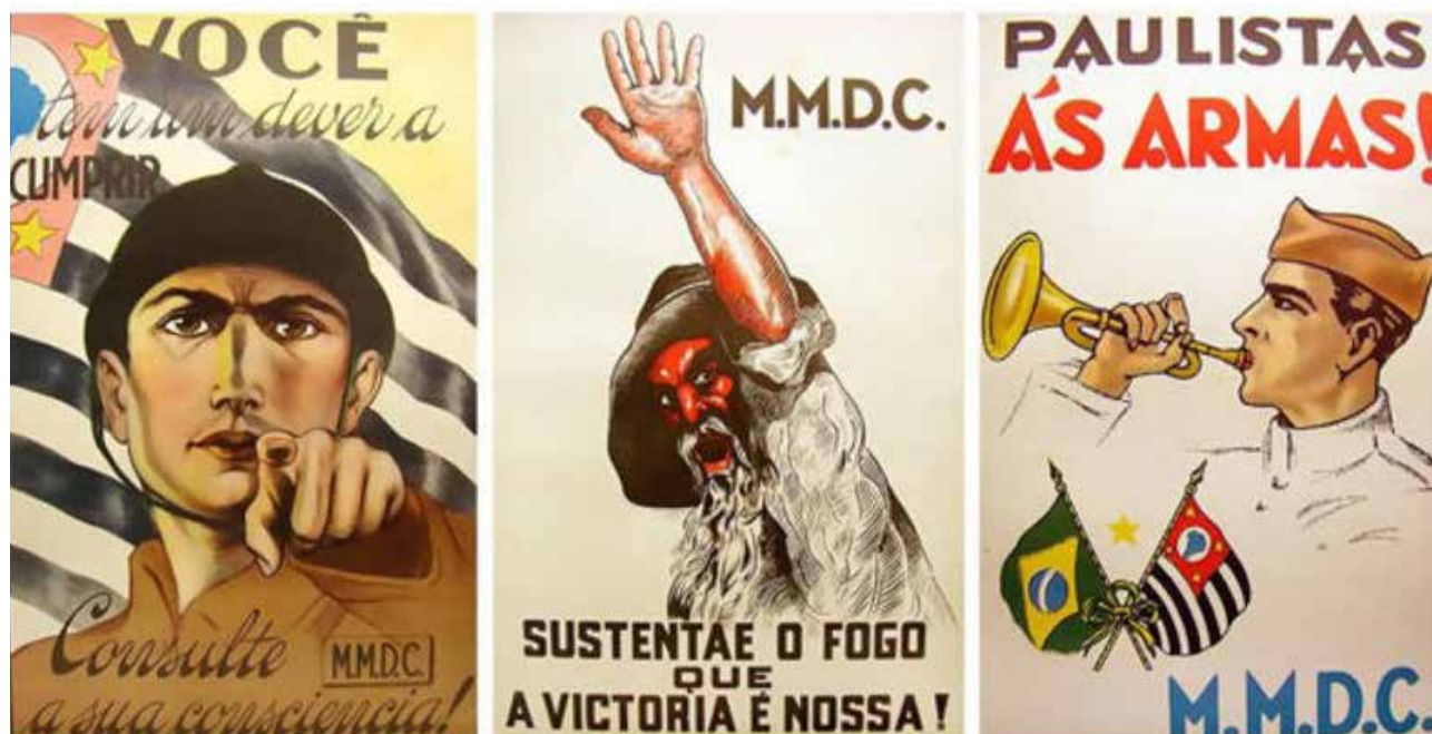
Figura 06: Propaganda dos constitucionalistas, conclamando a população a pegar em armas. Disponível em: < http://exame.abril.com.br/marketing/noticias/o-papel-da-propaganda-na-revolucao-constitucionalista >. Acesso em: 02 fev. 2016.

titucionalista de 1932 tornou-se símbolo do Estado de São Paulo, que comemora anualmente os feitos de seus heróis no dia 09 de julho. Um grande monumento foi erigido no bairro do Ibirapuera, na capital