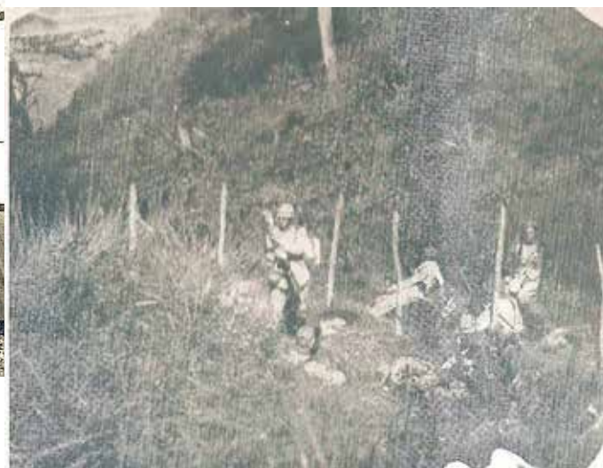
Figura 04: Soldados paulistas no Vale do Paraíba, na cidade de Cruzeiro (SP).

Durante os combates, houve baixas de ambos os lados. Autores como Guilherme Frota (2000), comparam à situação estratégica com a guerra de trincheiras ocorrida na I Guerra Mundial 6 . Três dias após o início do confronto, aviões governistas bom-