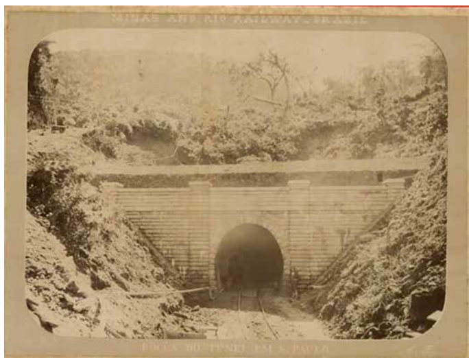
Figura 01: Saída do Túnel da Mantiqueira. Disponível em: < https://www.facebook.com/VilaDaNossaSenhoraDaConceicaoDoCruzeiro/timeline >. Acesso em: 31 jan. 2016.