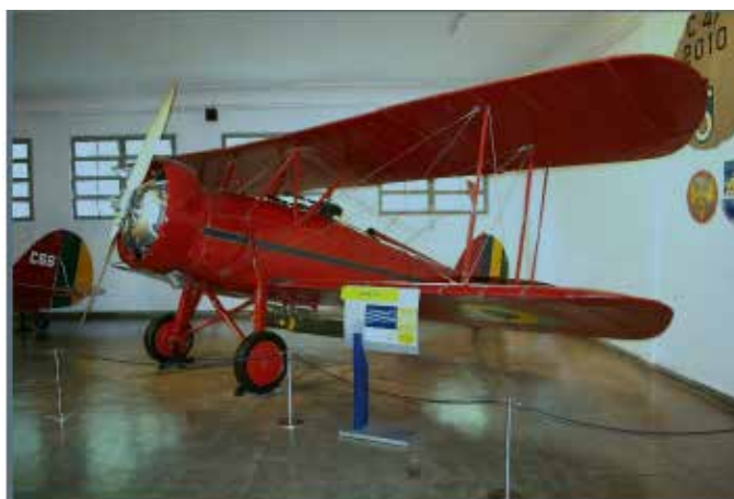
Figura 05: “Vermelhinho”, utilizado pelas tropas legalistas na revolução de 1932. Exemplar pertencente ao MUSAL, situado na cidade do Rio de Janeiro. Disponível em: < http://www.ecsbdefesa.com.br/defesa/fts/AV1932.pdf >. Acesso em: 01 fev. 2016.

As forças federais pintavam de vermelho suas aeronaves, que foram apelidadas de “vermelhinhos”, cumprindo ao todo mais de 2500 horas de voo, sob o comando do então Major Eduardo Gomes, que viria a se tornar, anos mais tarde, Patrono da Força Aérea Brasileira (NETO, 2013). Entre os paulistas, o meio aéreo também foi utilizado, apesar de ter sido de maneira improvisada, com a aquisição de algumas poucas unidades pilotadas por civis (FROTA, 2000).