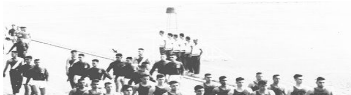
Figura 3: Desfile de abertura dos jogos do Troféu Henrique Lage - 1959

Sob a influência da Guerra Fria, na qual as ameaças nucleares e os avanços ideológicos da esquerda revolucionária em áreas da América Latina, da Ásia e da África eram uma realidade, o Exército Brasileiro organizou um seminário que discutiria as estratégias político-militares necessárias para fazer frente à ordem mundial que se impunha (ACADEMIA MILITAR DAS AGULHAS NEGRAS, 2011, p. 373).