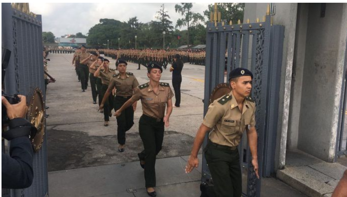
Figura 5: Primeira turma mista de cadetes

Em 15 de fevereiro de 2018, a AMAN recebeu a primeira turma mista de novos cadetes. A Turma Dona Rosa da Fonseca é composta por “34 mulheres concludentes da Escola Preparatória [...] admitidas no concurso para a EsPCEX em 2016 e agora chegam nas Agulhas Negras” (BRASIL, 2018a).