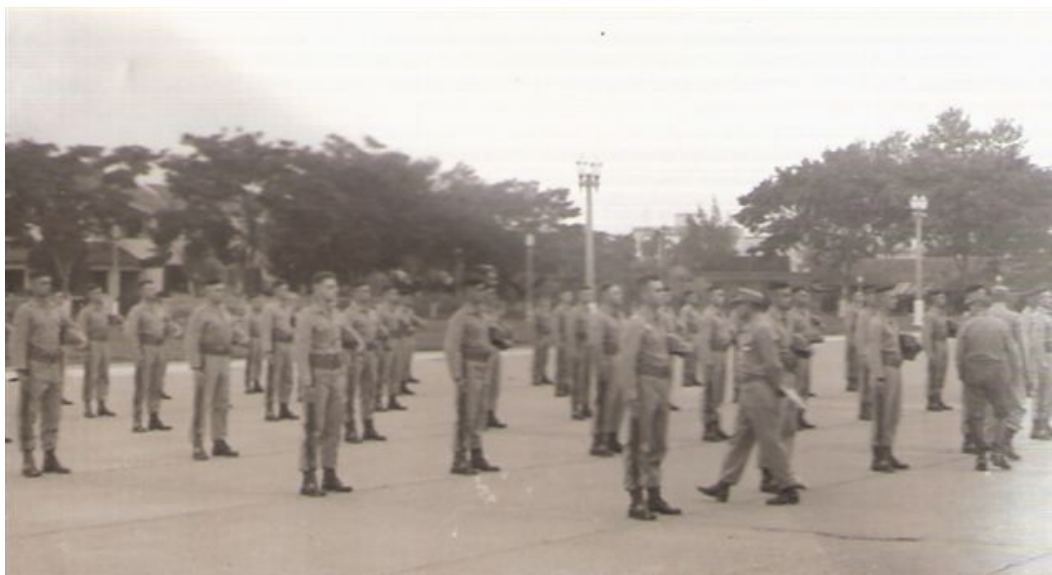
Figura 4: Concurso de Ordem Unida – Curso de Infantaria, 1962

A população resendense assistiu, apreensiva, a ação dos cadetes que se interpuseram entre as forças do I e as do II Exércitos, que marchavam para um possível confronto durante o movimento deflagrado em março de 1964 (RODRIGUES, 2014, p. 5). A presença de jovens cadetes foi um divisor de águas, no sentido de promover o espírito de camaradagem entre os irmãos de armas, evitando um embate entre as forças.