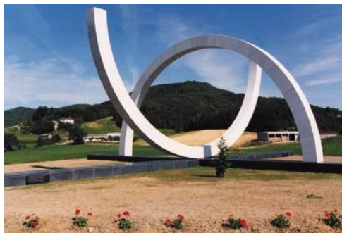
Figura 06: Monumento Liberazione , ao fundo o Monte Castello.