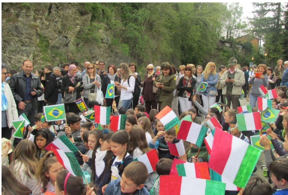
Figura 10: crianças cantam a Canção do Expedicionário

Abaixo, seguem algumas fotos dessa solenidade registradas pelos militares: