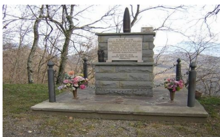
Figura 07: Monumento Castelnuovo di Vergato.

Esse fato é registrado em algumas historiografias brasileiras no episódio conhecido como "Os três heróis de Castelnuovo", quando o local foi conquistado pelos brasileiros, em março de 1945. Próximo ao cemitério foram encontradas três sepulturas de soldados brasileiros que haviam tombado em combate 28