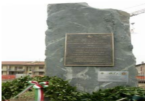
Figura 09: monumento em Collecchio.