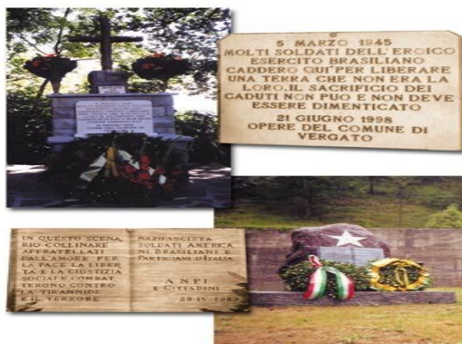
Figura 08: monumento em Castelnuovo di Vergato.