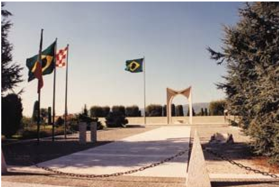
Figura 2: Atual Monumento Votivo, em Pistóia.