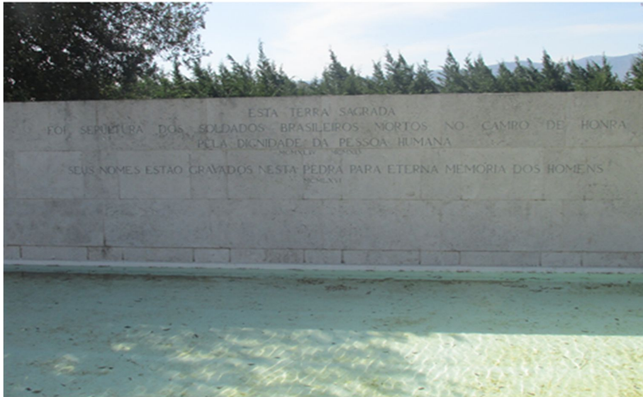
Figura 1: cemitério de Pistóia na Itália: inscrição em homenagem aos militares da FEB mortos em combate.