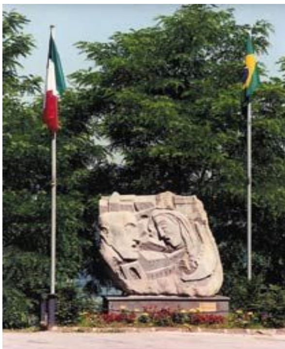
Figura 3: monumento Alla Libertá, em Montese.