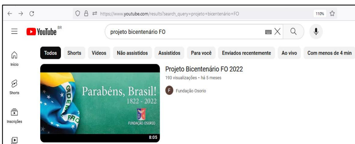
Figura 3 – Vídeo “Projeto Bicentenário FO 2022”

Após finalizado, o vídeo teve ampla divulgação e buscou-se que toda a comunidade escolar tomasse conhecimento do vídeo institucional, lançado na plataforma YouTube e intitulado como “Projeto Bicentenário FO 2022”, com duração de oito minutos, cujo acesso ocorre por meio do link: https://www.youtube.com/watch?v=SEsgqlhEloc .