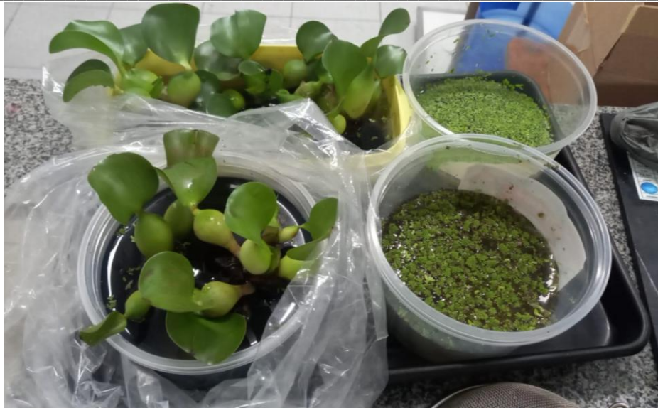
Figura 2: Macrófitas aquáticas utilizadas no estudo

Para avaliar a eficiência do sistema, foram realizadas análises físico-químicas do efluente bruto e tratado. O efluente doméstico bruto foi despejado no primeiro compartimento e, após um tempo de detenção hidráulica (TDH) de 1 e 5 dias, o efluente tratado foi coletado no quarto compartimento do sistema vertical.