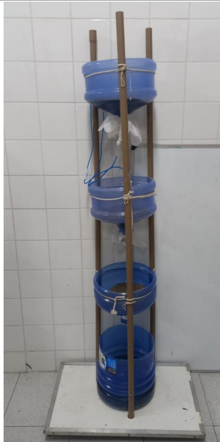
Figura 1: Sistema vertical para tratamento de esgoto

Para a montagem do sistema, utilizou-se areia previamente higienizada com água destilada e um consórcio com três espécies de macrófitas aquáticas: Lemna minor , Eichhorniacrassipes e Azolla sp. (Figura 2).