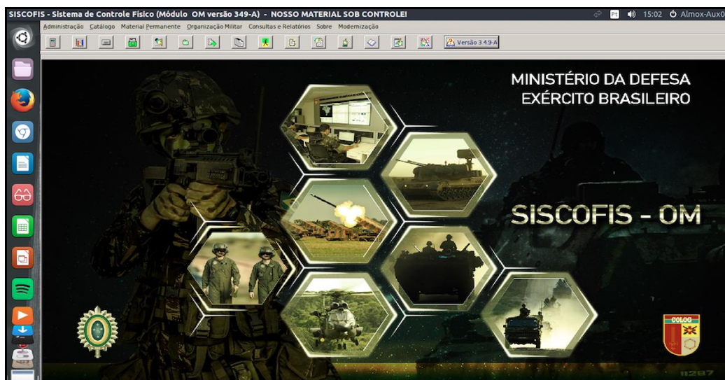
Figura 2: Tela inicial do aplicativo SISCOFIS – OM.