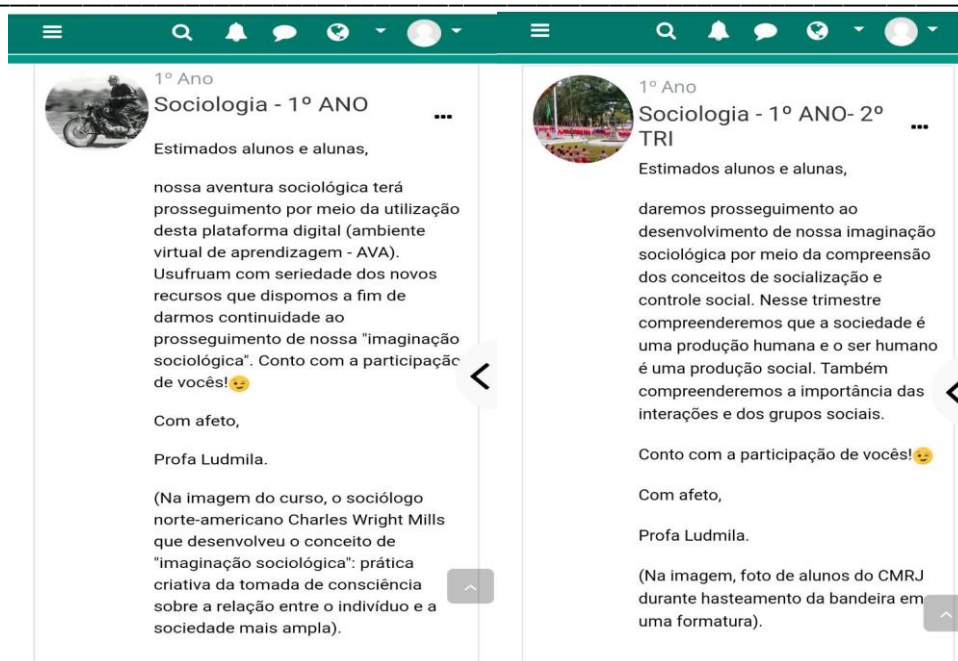
Imagem 3; capa de apresentação do curso 3ºTrim.; Fonte: AVA