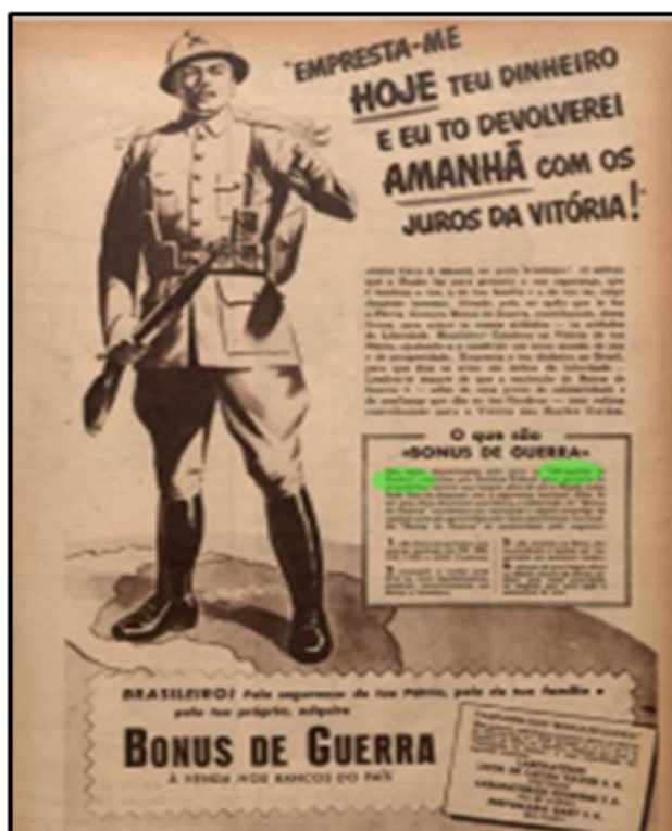
Figura 3 – Propagandas sobre os Bônus de Guerra.