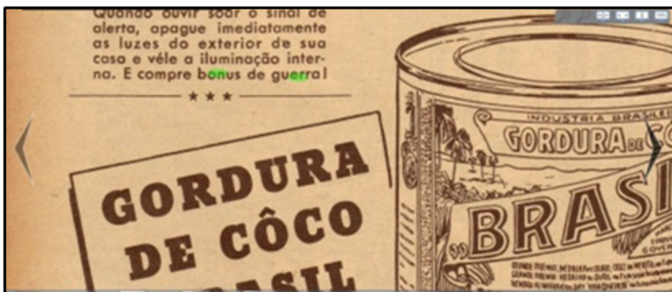
Figura 2: Propaganda da Gordura de Côco Brasil.