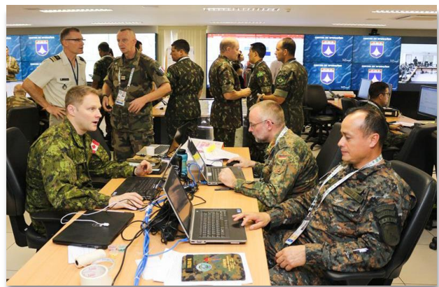
Fig 3 - Componente militar do Sítio Brasil da Operação Viking 2018 (7)

O Estado-Maior do Componente Militar no sítio Brasil foi representado pela 1ª Brigada Multinacional das Nações Unidas no âmbito do exercício sendo efetivamente mobiliado por militares de diferentes países. Comandado por um oficial General do Brasil, contou com a participação de oficiais do Exército e da Força Aérea de países da América do Norte, da América Central, da América do Sul, da Europa e da Ásia.