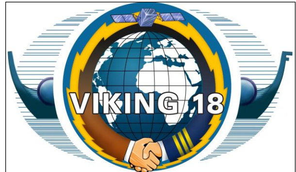
Fig 1 - Logotipo da Operação Viking 2018 1

do Atlântico Norte (OTAN), entre as cerca de 80 organizações governamentais, não governamentais e internacionais.