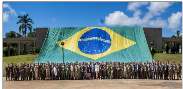
Fig 2 - Participantes do Sítio Brasil do Exercício Viking 2018 (5)

O sítio Brasil do Exercício Viking 2018 foi estabelecido na Capital Federal, Brasília-DF, pelo Exército Brasileiro (EB), por intermédio de seu Comando de Operações Terrestres (COTER). Civis, militares e policiais de mais de 20 países trabalharam nas instalações do Comando Militar do Planalto (CMP), desenvolvendo suas atividades de modo integrado com as ações realizadas em todos os outros sítios remotos do exercício, em especial com o estabelecido na Suécia, sede do Quartel-General do Exercício Viking.