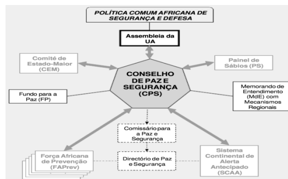
Figura 3 – Arquitetura de Paz e Segurança Africana Fonte: ESCORREGA (2010, p. 143).

Para viabilizar as pretensões da UA em segurança e defesa, a APSA conta com o Conselho de Paz e Segurança (CPS) (Figura 3), pilar central e órgão de tomada de decisões sobre a prevenção, resposta e resolução de conflitos, bem como pela coordenação de respostas rápidas e eficientes em situações de crise regionais. O CPS é apoiado nas suas tarefas por outros órgãos da APSA, nomeadamente o Comitê de Estado-Maior (CEM), o Painel de Sábios (PS), o Sistema Continental de Alerta Antecipado (SCAA), a Força Africana de Prevenção (FAP) e o Fundo para a Paz (FP). Há, igualmente, uma Arquitetura Complementar de Governo Africano, voltada para ações de incentivo à democracia e governabilidade (UA, 2015, p. 13).