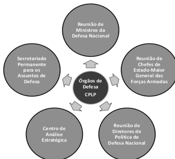
Figura 2 – Órgãos da componente de defesa da CPLP

Importante ressaltar os órgãos da componente de defesa da CPLP: i) Reunião de Ministros de Defesa Nacional (MDN) ou equiparados dos Estados-membros; ii) Reunião de Chefes de Estado-Maior General das Forças Armadas (CEMGFA) ou equiparados dos Estados-membros; iii) Reunião dos Diretores de Política de Defesa Nacional (DPDN) ou equiparados dos Estados-membros; iv) CAE; e v) Secretariado Permanente para Assuntos de Defesa (SPAD) (CPLP, 2006, pp. 6-12; 2016a, pp. 5-7). A Reunião de Diretores dos Serviços de Informações Militares ou equiparados, conforme a proposta de revisão do PCCDD (CPLP, 2018 p. 8), deixou de integrar a estrutura de defesa da CPLP. De fato, tais reuniões nunca ocorreram (SERRA, 2018)(Figura 2).