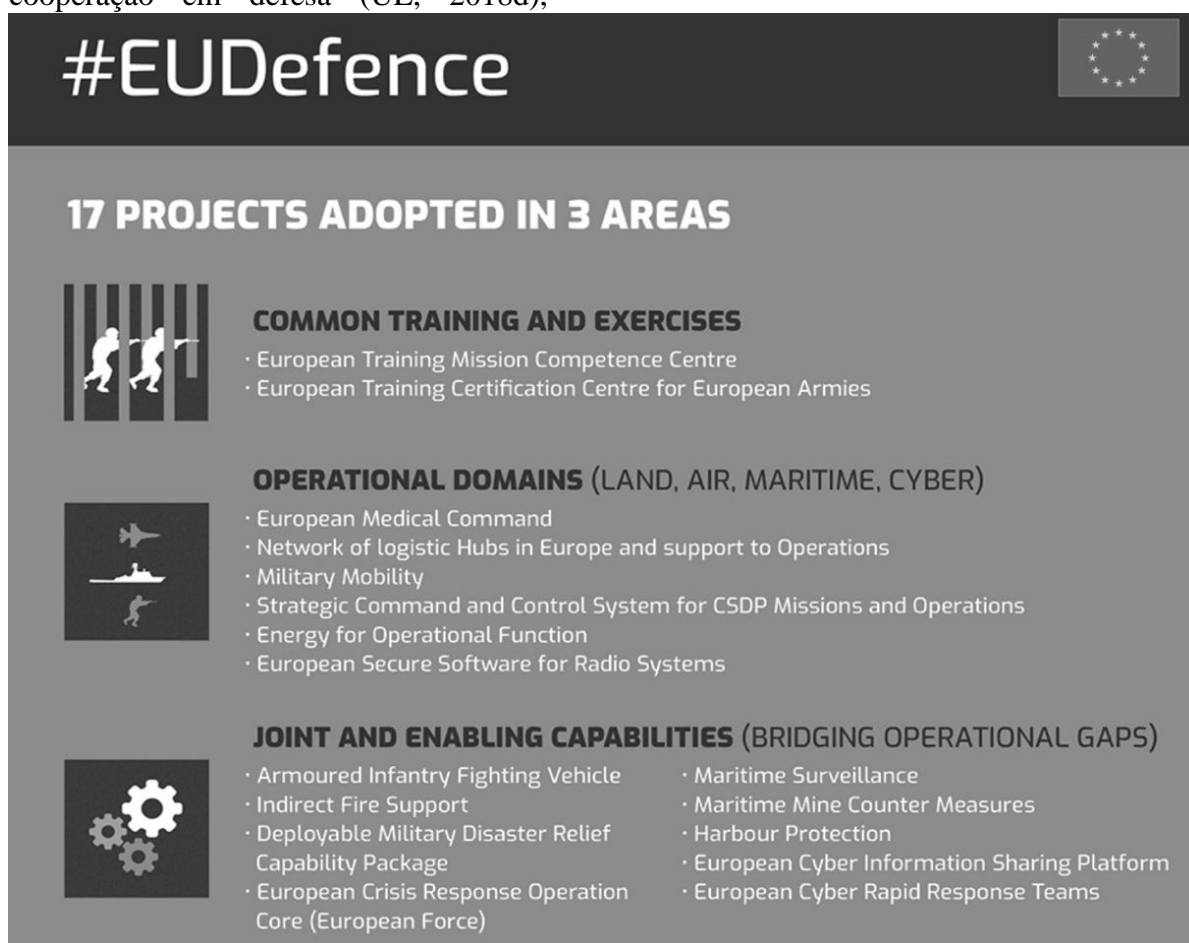
Figura 5 – Projetos da CEP da UE – 2018

Em 2017, passou-se à fase de implementação da estratégia através de medidas concretas, como a já prevista, mas recentemente ativada, Cooperação Estruturada Permanente (CEP), visando o aprofundamento da cooperação entre os Estados-membros na edificação de capacidades militares e na ampliação de sua disponibilidade operacional. Para tal, são desenvolvidos projetos de fortalecimento das capacidades conjuntas em três áreas: treino e exercícios; domínios terrestre, aéreo, naval e ciberespaço; e edificação de capacidades necessárias (Figura 5) (UE, 2018d).