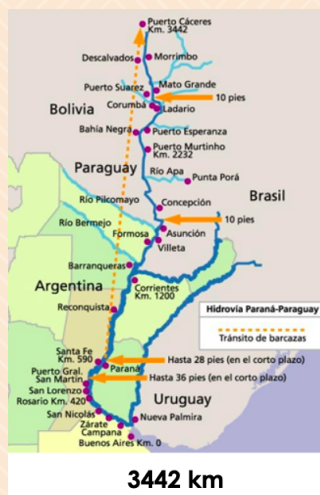
Hidrovia Paraguai - Paraná