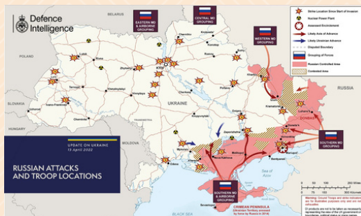
Situação da guerra na Ucrânia em 16 Abr 2022.

- EUA aprova venda de novo sistema antiaéreo para Taiwan