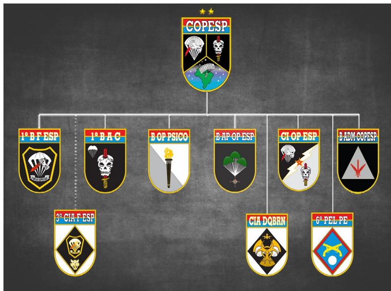
Estrutura Organizacional do COpEsp.