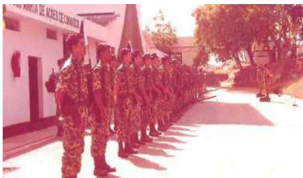
Criação do DFEsp.

Em 1968, o curso de Cmdos e o curso de F Esp, desenvolvidos no Centro de Instrução Especializado Aeroterrestre, foram oficialmente reconhecidos. Nesse mesmo ano, foi ativada a primeira unidade de Op Esp do EB, o Destacamento de Forças Especiais (DFEsp), organização militar (OM) de valor companhia, organizado com um destacamento de coordenação e controle e dois DOFEsp, com 12 homens cada (4 oficiais e 8 sargentos), perfazendo o total de 30 combatentes.