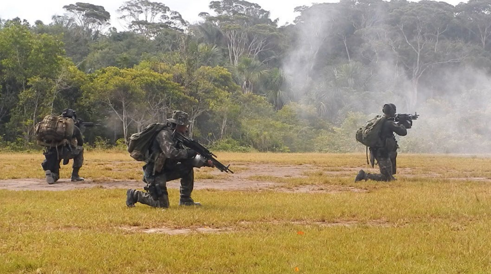
3ª Companhia de Forças Especiais em operação na Amazônia.

O B Ap Op Esp tem por missão realizar o apoio ao combate e o apoio logístico ao COpEsp e às suas OM subordinadas, particularmente, em pessoal e material, além de desdobrar a base de operações especiais. Nesse sentido, realiza o apoio à infiltração e à exfiltração dos elementos operativos.