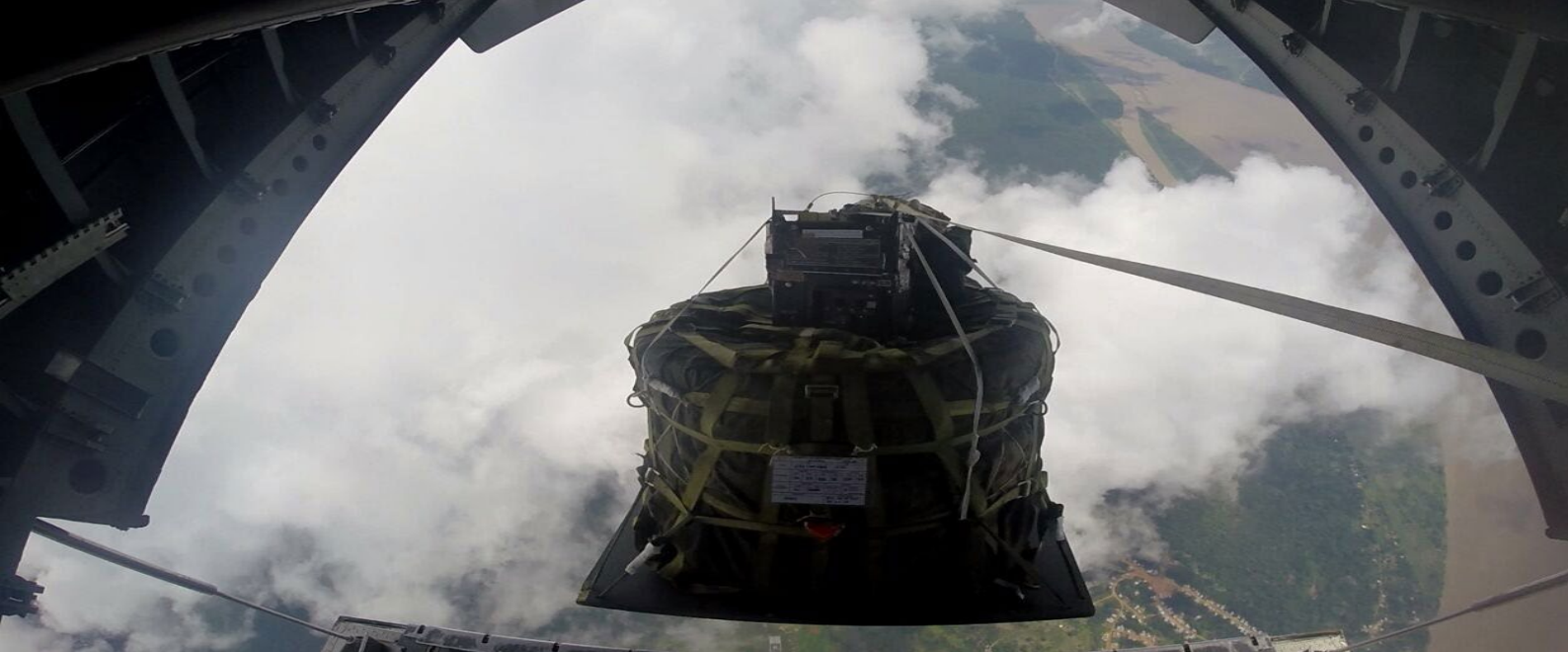
Lançamento livre de ressuprimento em apoio às F Op Esp.

Antecipando-se às novas demandas, o Btl Ap Op Esp realizou recentemente estudos para aquisição de: