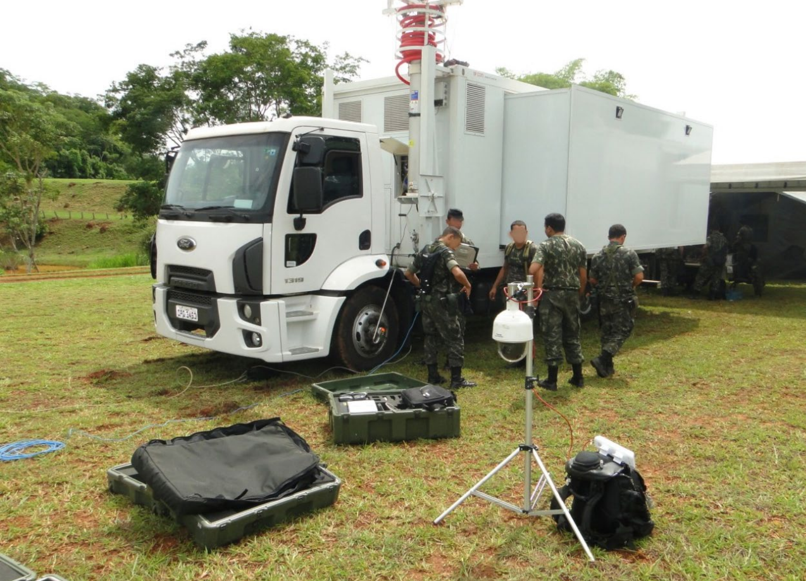
Desdobramento da cabine C 2 em apoio às Op Esp.