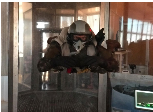
Operador de forças especiais realizando adestramento de queda livre.

Desde sua entrada em operação, em 2008, a seção tem apoiado os elementos operacionais, contabilizando mais de 22 mil horas de voo, que subsidiaram a melhoria da performance em voo e a redução significativa da quantidade de acidentes em salto livre.