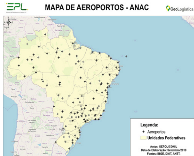
Mapa 2 - Aeroportos do Brasil.

O mapa 2 apresenta os aeroportos do Brasil que estão sendo utilizados na Op COVID, de acordo com a Agência Nacional de Aviação Civil (ANAC).