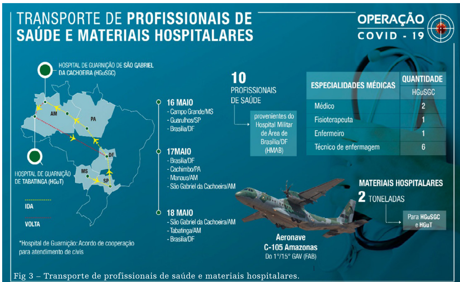
Fig 3 – Transporte de profissionais de saúde e materiais hospitalares.

aos hospitais de São Gabriel da Cachoeira – AM e Tabatinga – AM (MINISTÉRIO DA DEFESA, 2020e).