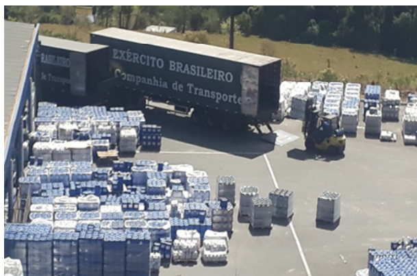
Fig 2 – 2ª Cia Trnp transportando álcool etílico hidratado para Bahia.

A 2ª Cia Trnp transportou 50 toneladas de álcool etílico hidratado 70º INPM de Socorro – SP para Salvador – BA. Todo material foi entregue ao Serviço Nacional de Aprendizagem Industrial (SENAI) para ser empregado na sanitização de hospitais e centros de saúde da capital baiana e do interior (MINISTÉRIO DA DEFESA, 2020g).