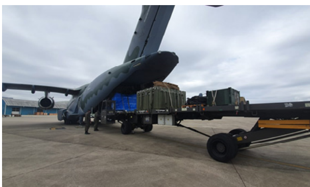
Fig 5 – Transporte de equipamentos médicos.

A próxima figura retrata o embarque de uma carga que foi transportada do Rio de Janeiro - RJ para Manaus – AM. Nessa missão foi transportada uma ambulância e diversos equipamentos hospitalares, totalizando o peso da carga em 6,9 toneladas (FORÇA AÉREA BRASILEIRA, 2020).