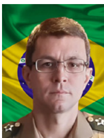
TENENTE-CORONEL FERREIRA Chefe da Seção de Planejamentos e Estudos do Centro de Controle Interno do Exército.