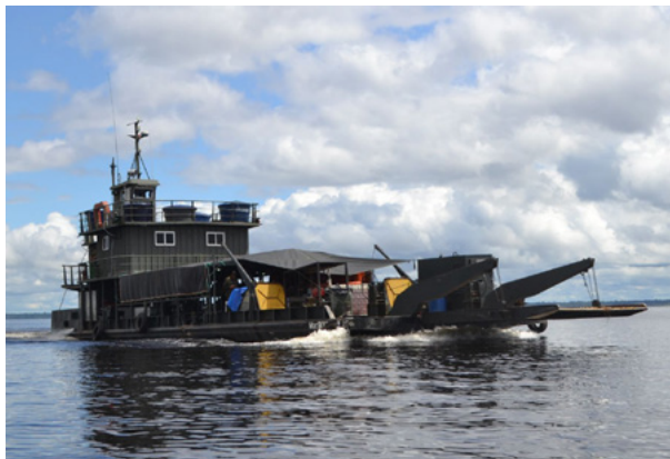
Fig 6 – Transporte equipes de saúde e tropas – 16ª Ba Log.

A figura 6 retrata o transporte fluvial realizado pela 16ª Ba Log de equipes de saúde e tropas da 16ª Brigada de Infantaria de Selva (16ª Bda Inf Sl) para atuarem no apoio às comunidades indígenas na região do Médio Solimões (EXÉRCITO BRASILEIRO, 2020h).