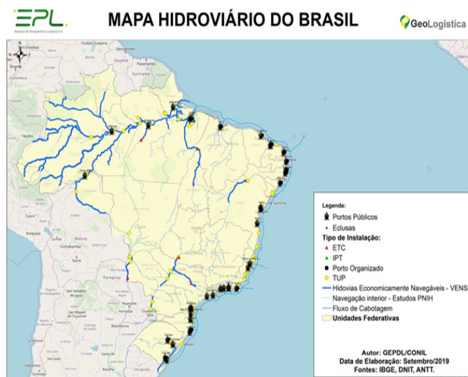
Mapa 3 – Hidroviias do Brasil.

O mapa 3 apresenta as principais hidroviias utilizadas no Brasil, para o transporte de pessoal e material, onde destacam-se os rios: Amazonas, Madeira, Tapajós, Mamoré, Solimões, Araguaia, Tocantins, São Francisco, Paraguai, Cuiabá e Tietê-Paraná (DNIT, 2020; DNIT, 2019).