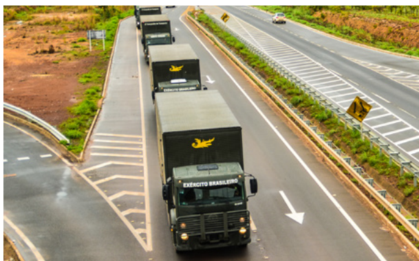
Fig 1 - Estabelecimento Central de Transportes do EB conduzindo material para a Região Nordeste.

A figura 1 retrata o apoio logístico do EB à Cruz Vermelha brasileira. Nessa ocasião, o ECT transportou 27 toneladas de material, como: alimentos, remédios e itens de higiene, do Rio de Janeiro para a Região Nordeste (EXÉRCITO BRASILEIRO, 2020w).