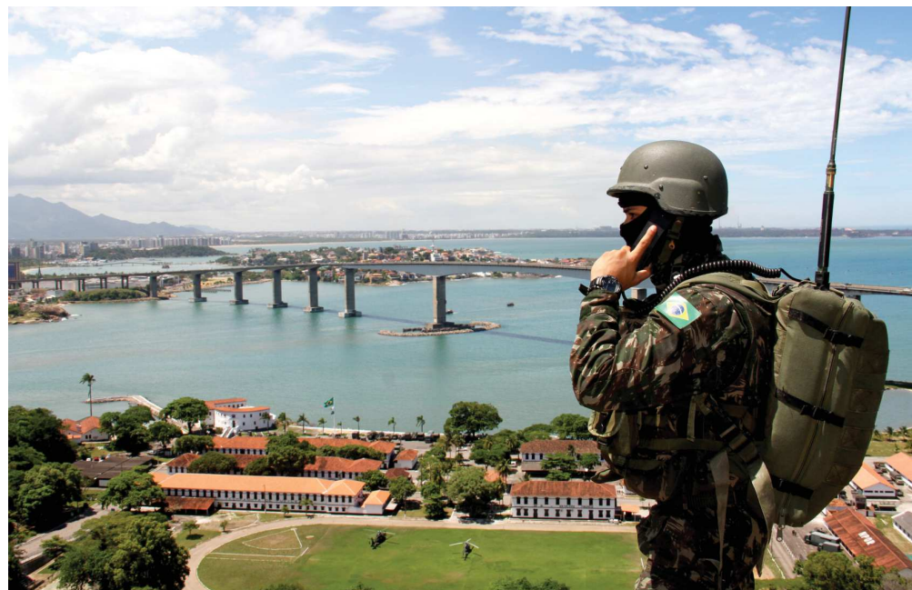
As Forças Armadas foram empregadas para a Garantia da Lei e da Ordem no Estado do Espírito Santo, no período de 06 de fevereiro a 16 de março de 2017

Operação Capixaba , na qual foi determinado pelo Presidente da República o emprego das Forças Armadas para a Garantia da Lei e da Ordem no Estado do Espírito