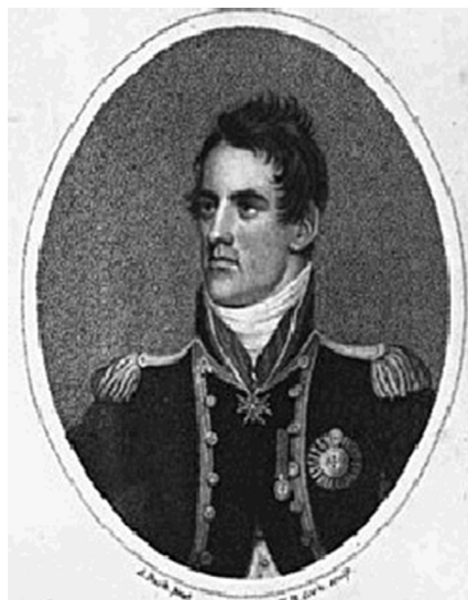
Figura 4 – Sir James Lucas Yeo

o rio, em botes, outra parte da força invasora transportava uma peça de artilharia. O ataque surpreendeu os franceses.