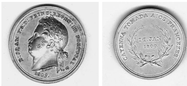
Figura 7 – Medalha de Caiena

A Conquista de Caiena é um dos mais admiráveis exemplos de realização de uma grande empresa, levada a efeito com elementos inteiramente inadequados.