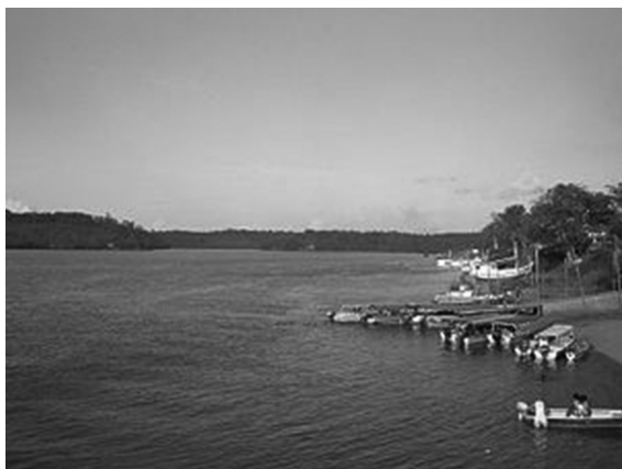
Figura 5 – Margens do rio Oiapoque