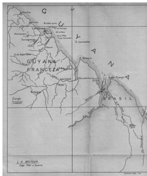
Figura 3 – Teatro de operações da expedição