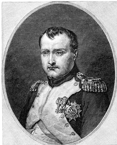
Figura 6 – Napoleão I

No dia 10, renovou-se a proposta de capitulação. Dia 11, o governador Victor Hugues aceitou e reuniu-se com o comandante Manuel Marques, para acertar as bases de sua rendição. Antes, porém, foi solicitado o desarmamento e a devolução dos escravos que haviam passado para o lado dos atacantes, no que tiveram atendimento. As bases da capitulação foram, em resumo: