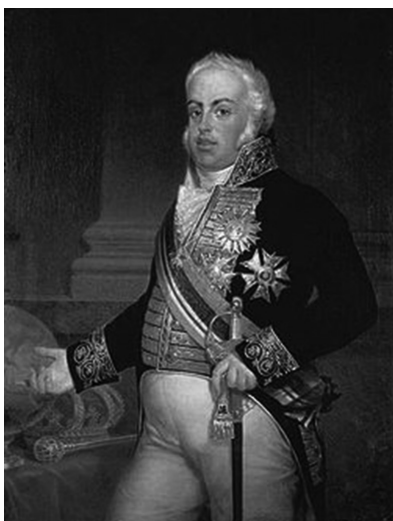
Figura 1 – D. João VI