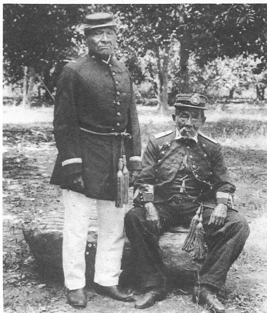
Figura 2 – Dois índios Terena, dos que combateram na Guerra do Paraguai, com uniformes de oficiais em desuso (acervo da Comissão Rondon, s/d)

A questão da entrega de patentes militares brasileiras aos Guaná (Terena) foi discutida pelo alemão Richard Rohde, que foi o responsável, entre os anos de 1883-1884, por uma mis-