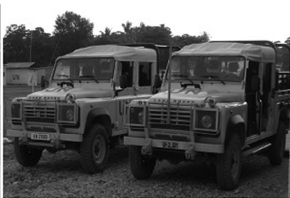
Figura 2 – Viaturas usadas pelo Esqd Fuz Mec durante os reconhecimentos no Haiti