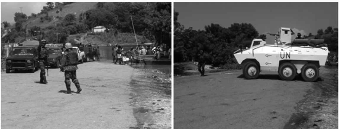
Figura 4 – Registro do levantamento de EEI sobre as regiões de passagem sobre o rio Roseaux, nas proximidades da localidade de Jérémie

A ONU não prevê, nas missões de paz, um serviço de inteligência. A missão fica extremamente vulnerável a boatos. Foi necessário empregar tropa inúmeras vezes para investigar informes cuja veracidade não se confirmava. Tal situação, sobretudo nos