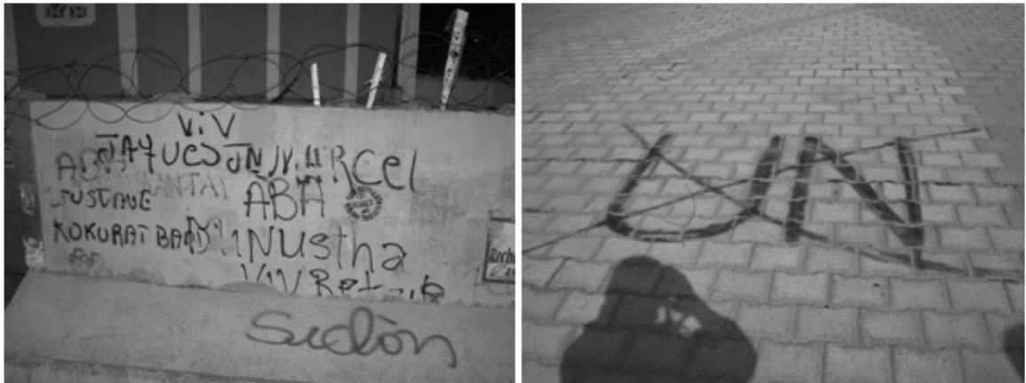
Figura 3 – Pichações 1 contrárias à ONU nas cercanias BRABAT

Coradini (2010, p.7) citou que o Esq. Fuz Mec era empregado na área de responsabilidade do BRABATT embarcado em suas VBTP e realizava diversas missões, tais como, patrulhamentos à pé e mecanizados, operações de controle de distúrbios, check points , 2 escoltas de comboios, operações de cerco, reconhecimento e outras.