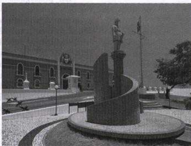
Figura 2 – Panteão de Sampaio, última e definitiva morada eterna

No corrente ano, decorridos vinte anos de existência do seu Panteão, desejamos que o espírito imortal de Sampaio permaneça para sempre, guarnecendo as seculares muralhas da nossa Fortaleza e inspirando as sucessivas gerações de infantantes do nosso Exército com seus exemplos de coragem e determinação. REB