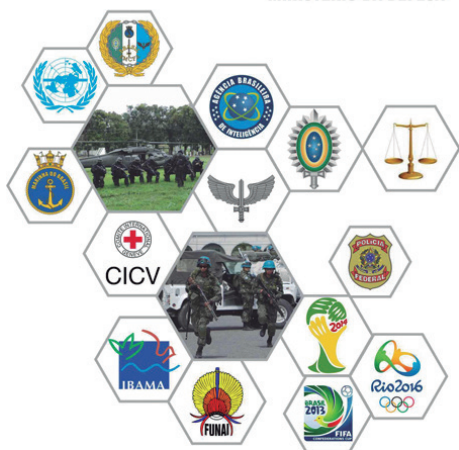
Figura 1 – Fôlder entregue durante seminário promovido pelo Ministério da Defesa sobre o tema “Operações Interagências”