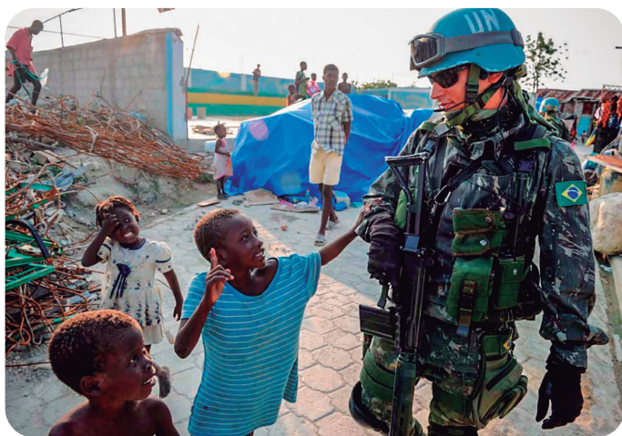
Figura 4 – Um Soldado brasileiro em diálogo com crianças haitianas. A cena bem representa a confiança dos cidadãos em geral e o profissionalismo da tropa.

Desse estudo de caso, confirma-se a assertiva “quem faz mais, faz menos”, especificamente sobre a aplicação do uso da força, entendendo-se ser este mais restritivo nas operações de paz do que nos conflitos “convencionais”.