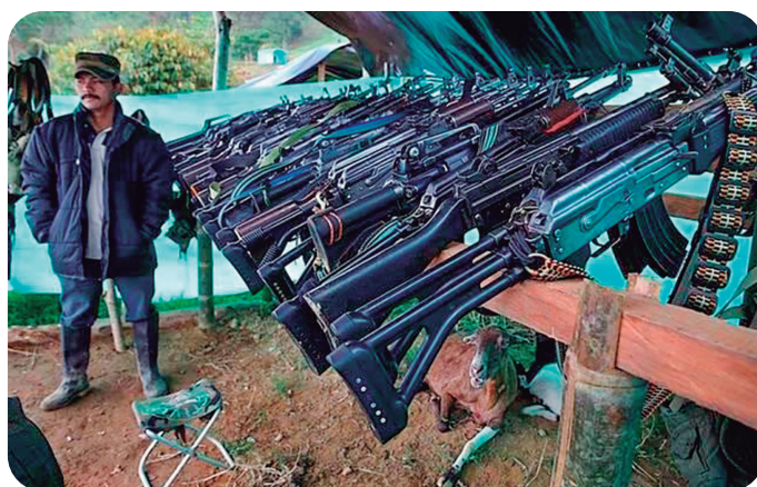
Figura 2 – Um membro das FARC, na Província de Tolima, Colômbia, observa a entrega de fuzis da guerrilha, parte do acordo de paz com o governo

As OTU também destacam a necessária sincronização com outras forças (missões conjuntas), agências e instituições governamentais (missões coordenadas ou interagências) e forças multinacionais (missões multinacionais ou combinadas) e a tarefa, ao ENC, de “segurança de área extensa”, que é a aplicação dos elementos de poder de combate para proteger a população, as próprias tropas, a infraestrutura, os ativos estratégicos e outras atividades.