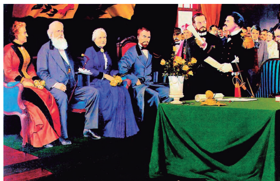
Figura 1 – Solenidade de inauguração da Bibliotheca do Exercito, em 4 de janeiro de 1882

Sua inauguração efetiva ocorreu em 4 de janeiro de 1882, contando, na solenidade de abertura, com a presença do imperador D. Pedro II, grande incentivador do desenvolvimento cultural do país, assim como de outros integrantes da família imperial brasileira, conforme se pode verificar na figura 1 .