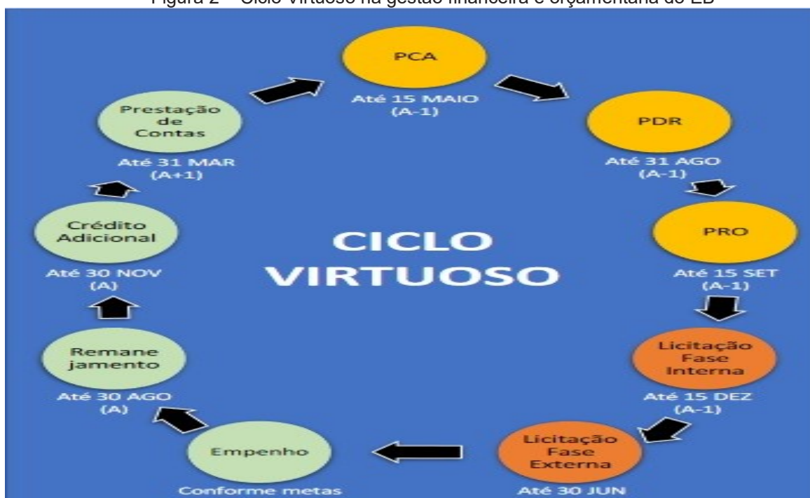
Figura 2 – Ciclo Virtuoso na gestão financeira e orçamentária do EB

Para isso, o planejamento e o emprego judicioso dos recursos públicos recebidos pelo EB tornam-se essenciais para a efetividade dos processos de aquisição, fundamentais para que se alcancem os objetivos institucionais da Força Terrestre, criando um ciclo virtuoso na gestão orçamentária e financeira, conforme figura abaixo.