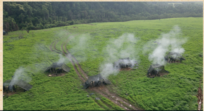
Operação Sentinela Alerta - Exercício da Função de Combate Fogos