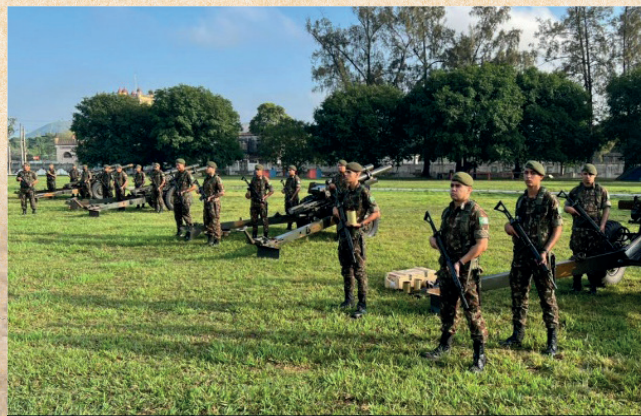
Comemoração aos 90 Anos do 31º GAC (Es)