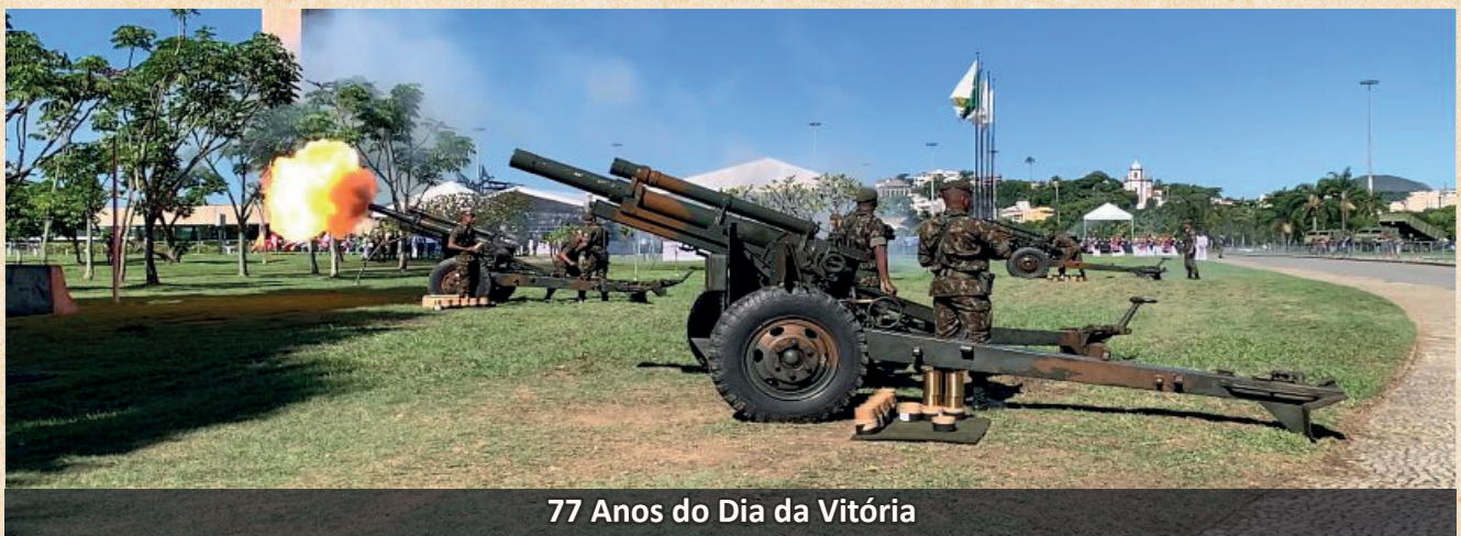
77 Anos do Dia da Vitória