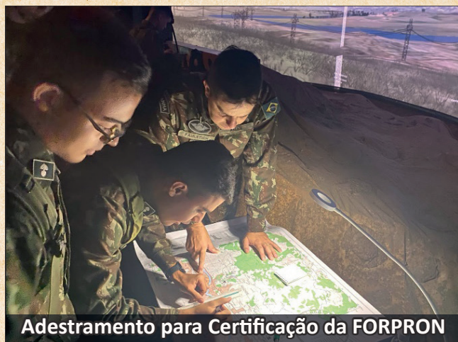
Adestramento para Certificação da FORPRON