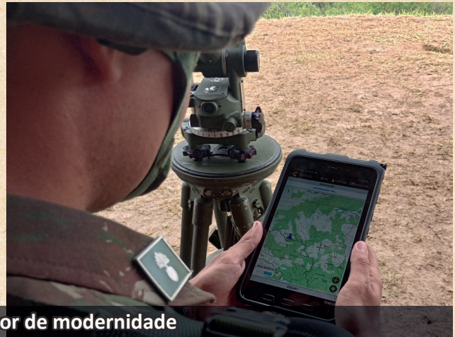
Projeto Gênesis - vetor de modernidade