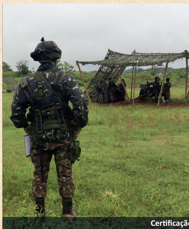
Certificação da FORPRON