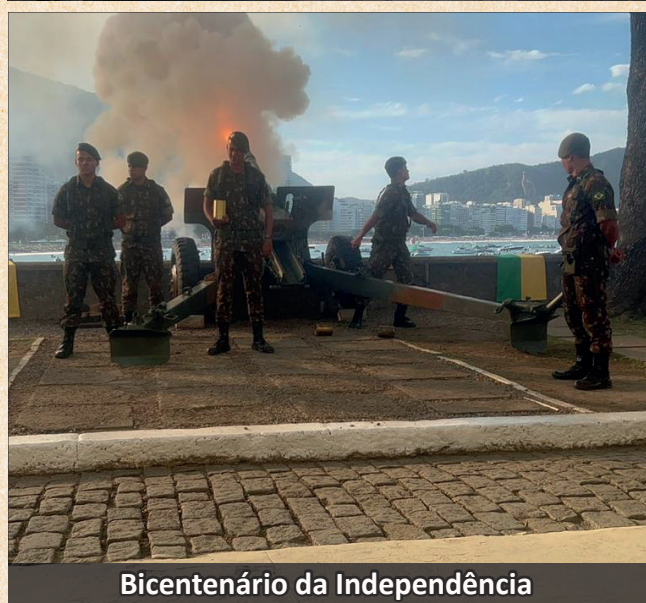
Bicentenário da Independência