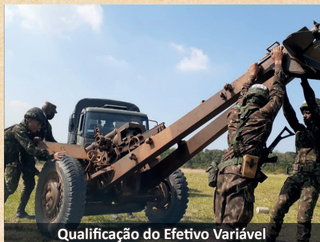
Qualificação do Efetivo Variável