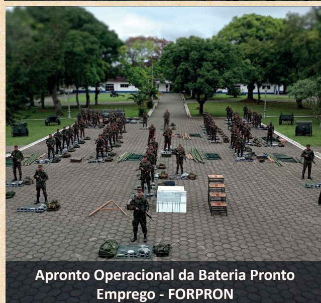
Apronto Operacional da Bateria Pronto Emprego - FORPRON