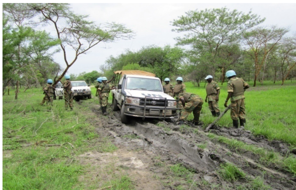
Figura 5. Estadas no interior do Sudão do Sul