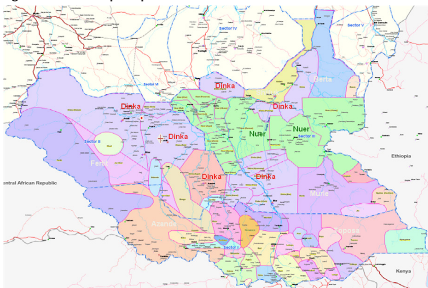
Figura 2. Áreas das principais tribos do Sudão do Sul.

Throughout the late 1970s and early 1980s there were many Southerners who claimed the region was threatened by 'Dinka domination'. The numbers of Dinka in the regional government, in the administration, and in some branches of security forces appeared to them to be out of proportion [...] (JOHNSON, 2011, p. 51).