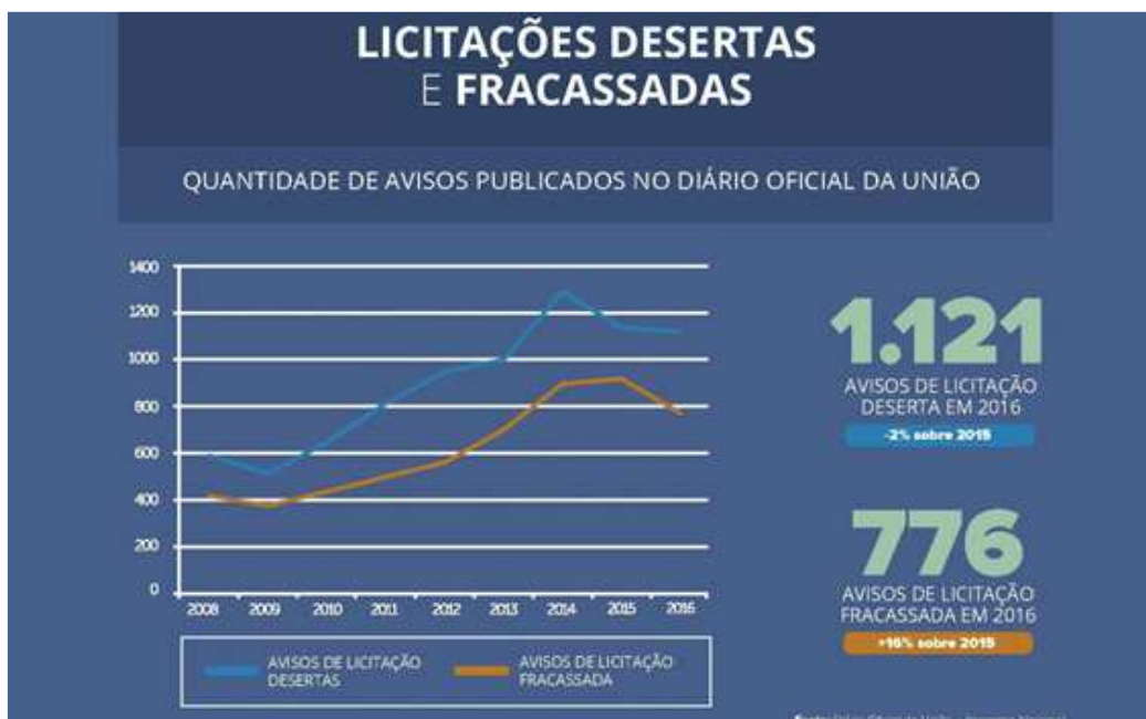
Figura 02: Licitações Desertas e Fracassadas

a questões mercadológicas. É o caso da licitação que fica deserta, na medida em que tal situação, a princípio, foge ao controle da Administração, isto é, não diz respeito a sua gestão.