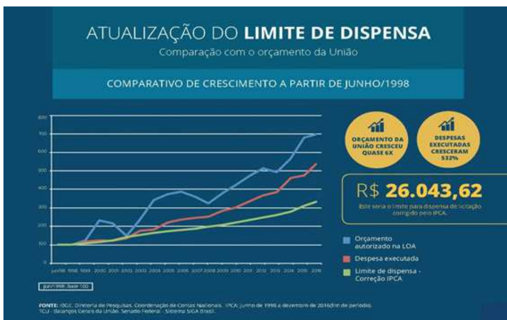
Figura 03 – Atualização do limite de dispensa

Na figura 3, observa-se que o estudo realizado pelo Instituto propõe um valor de R$ 26.043,62 (vinte e seis mil, quarenta e três reais e sessenta e dois centavos). Trocando em miúdos, o valor